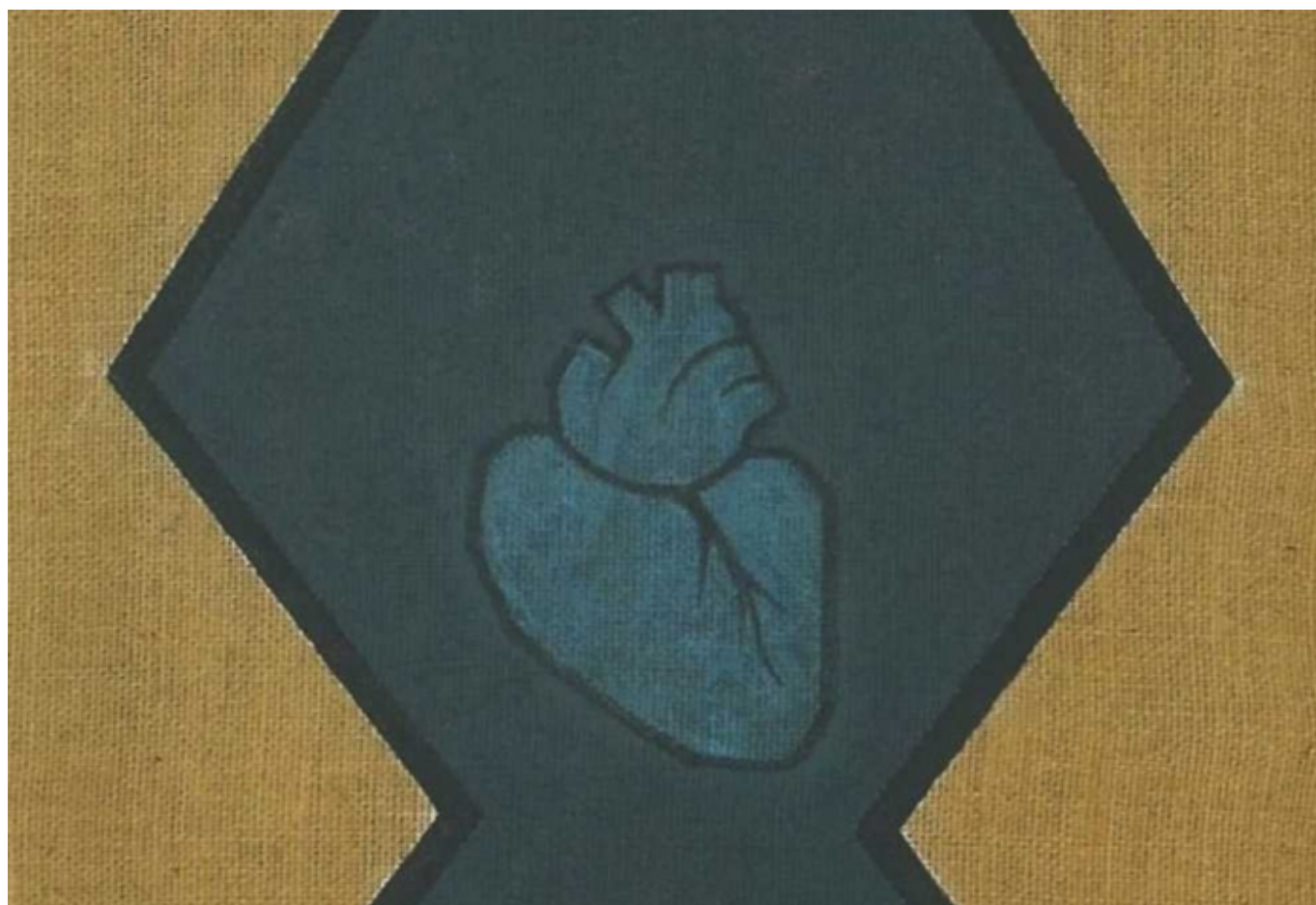
Фрагмент картины "On/Off" (© Inga Kiseleva)

Автор: Азамат Рахимов, Женева, 3. 06. 2013.