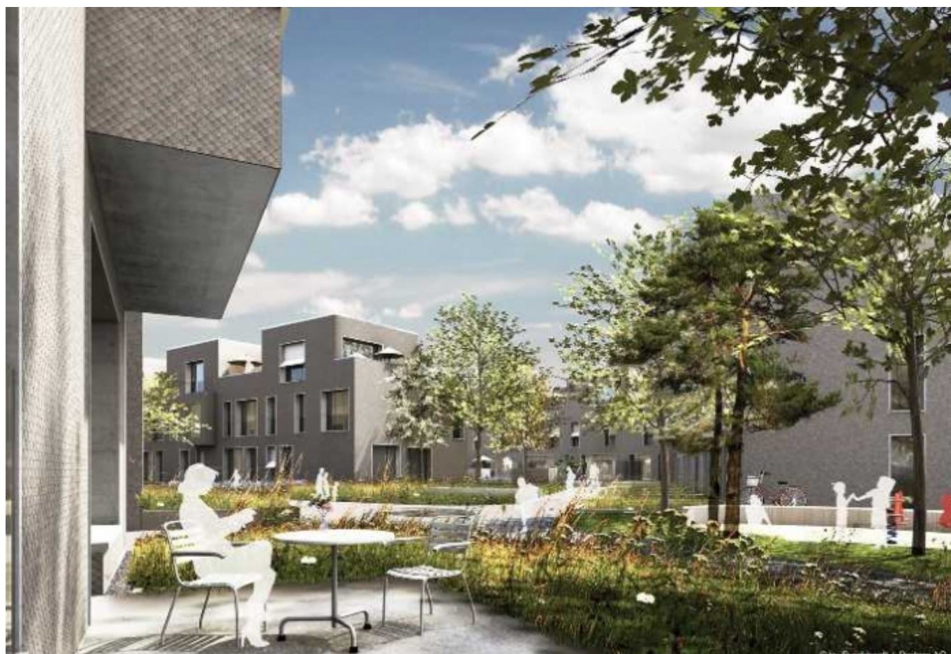
Квартал будущего Schorenstadt в Базеле © Implenia

Автор: Татьяна Гирко, Санкт-Галлен, 28. 05. 2013.