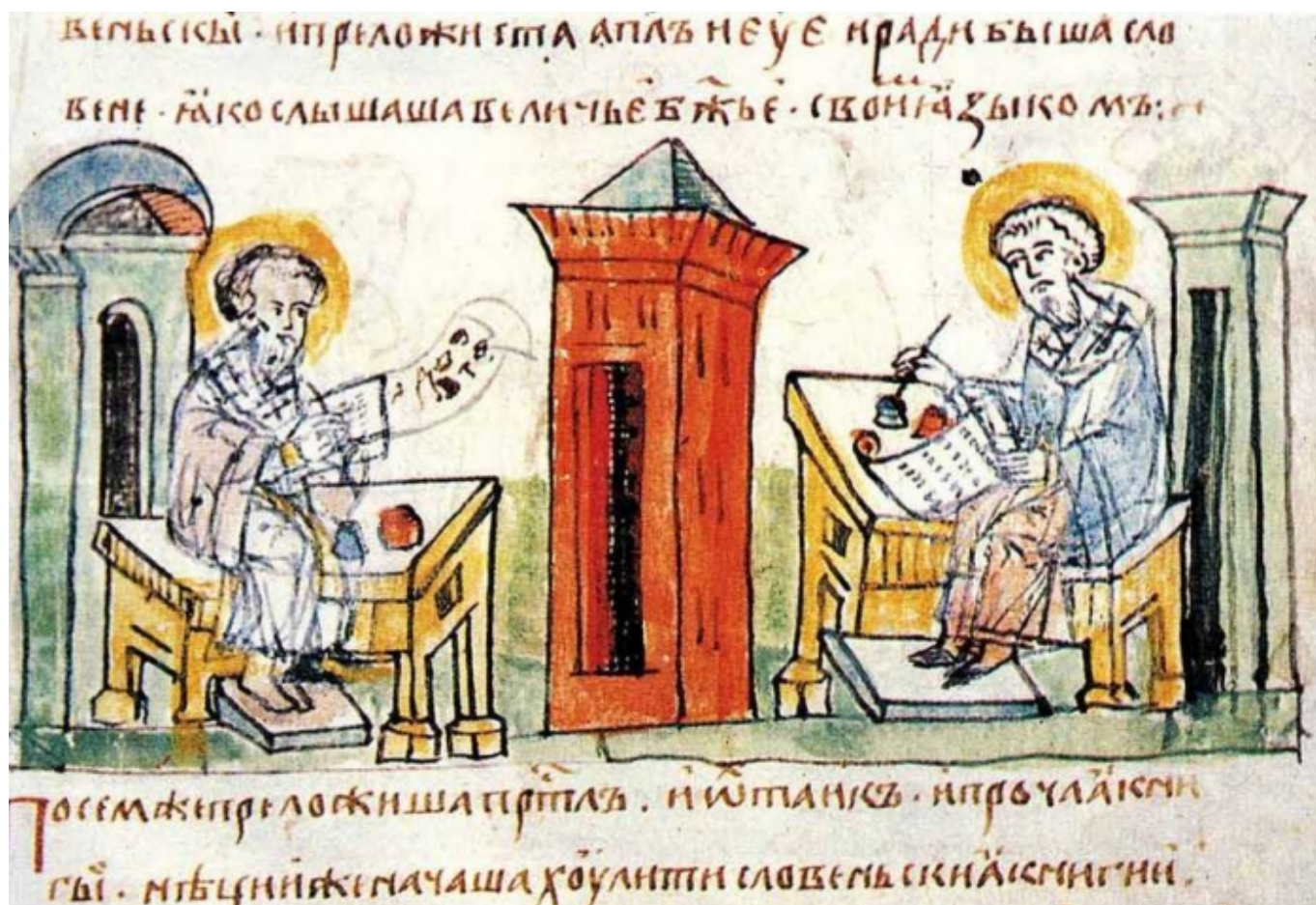
Святые Кирилл и Мефодий

Автор: Надежда Сикорская, Женева, 26. 04. 2013.