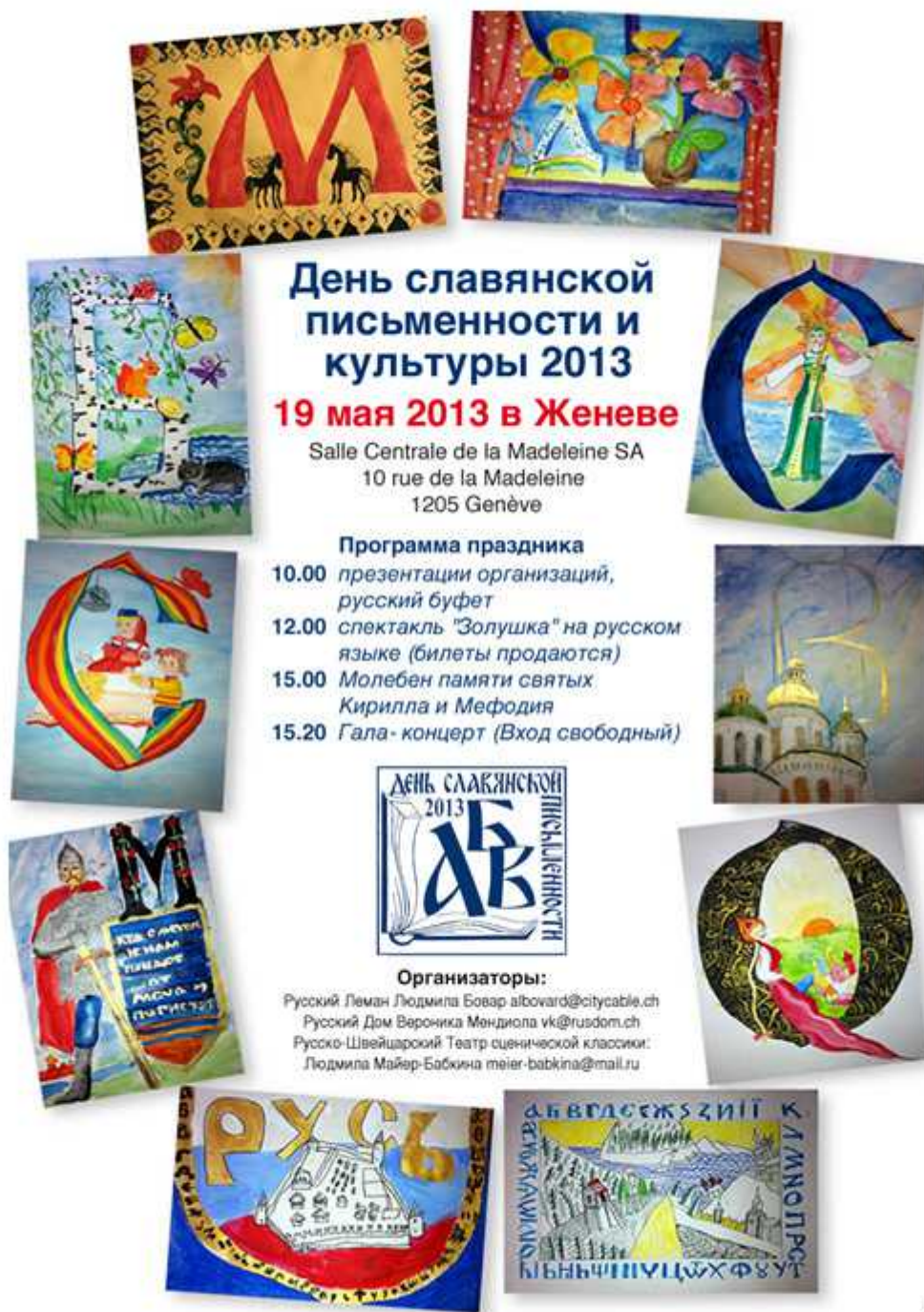
Афиша праздника 19 мая