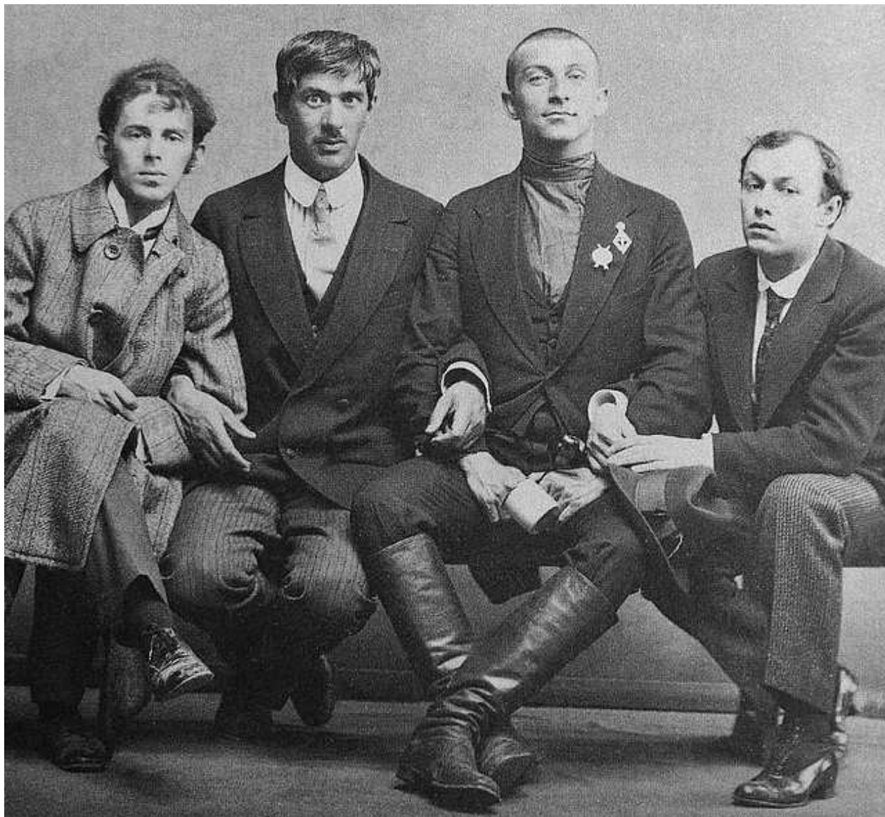
Футурист Лившиц (третий слева) в компании Мандельштама, Чуковского и Анненкова