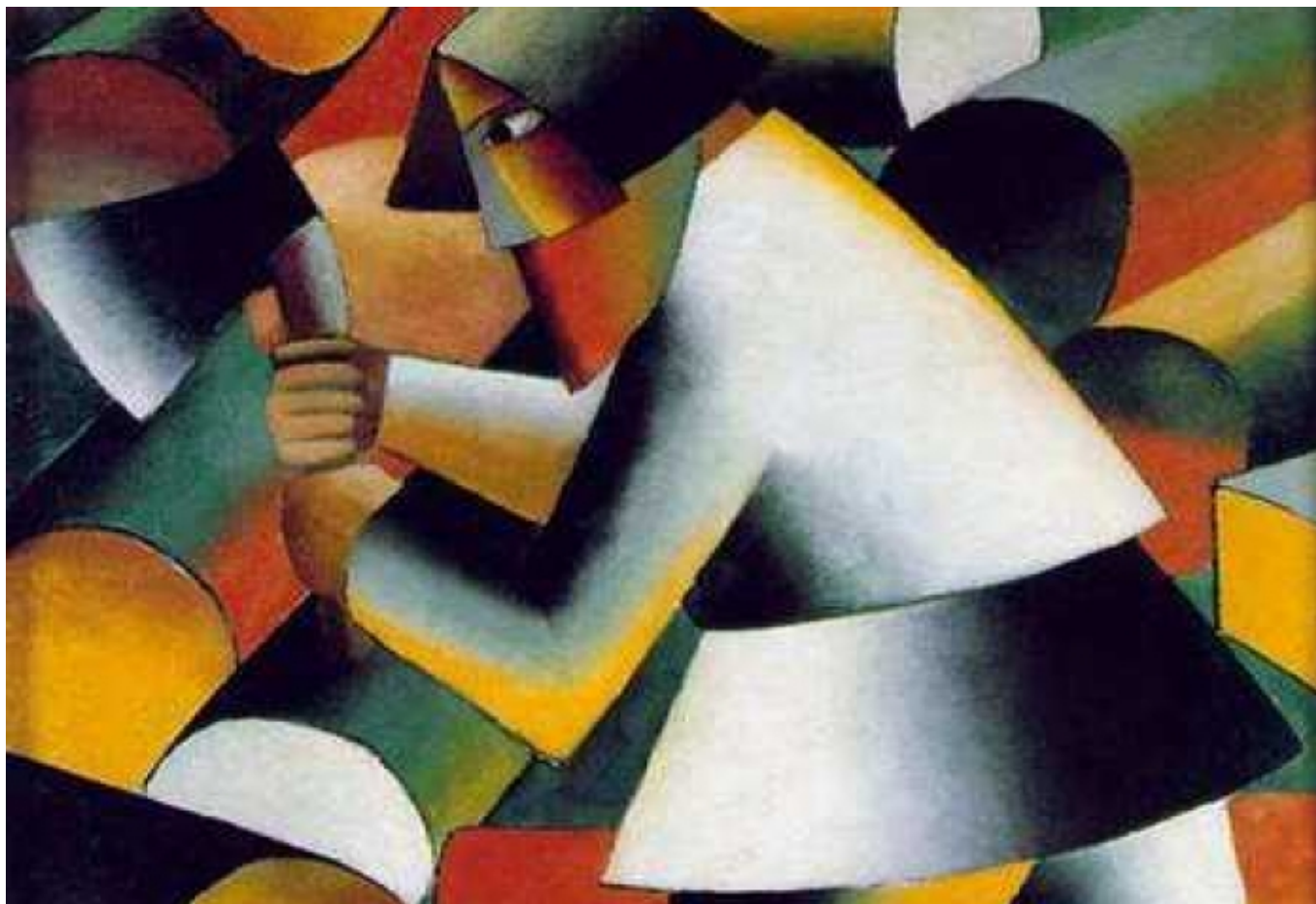
Лесоруб. Казимир Малевич. 1913 год

Автор: Азамат Рахимов, Женеве, 2. 04. 2013.