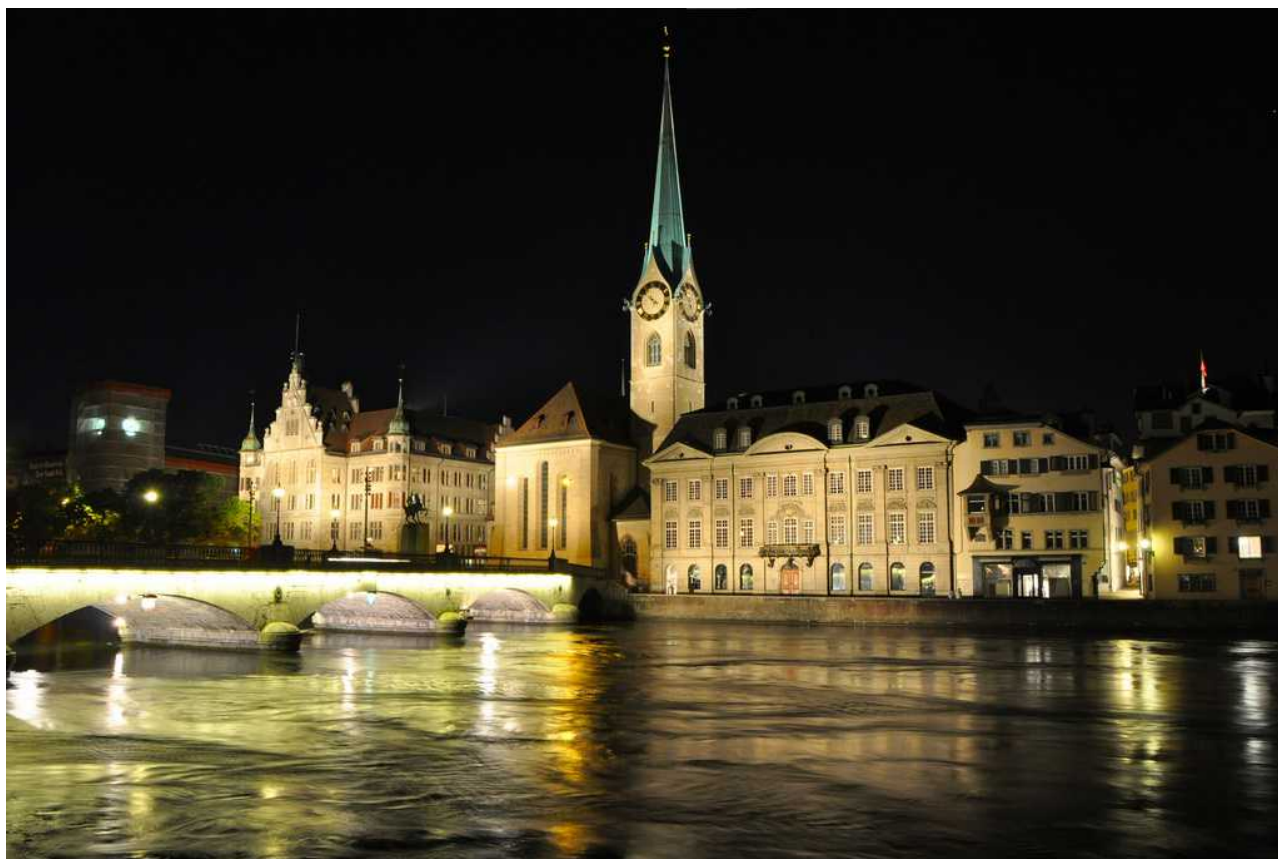
Фраумюнстер в ночные часы