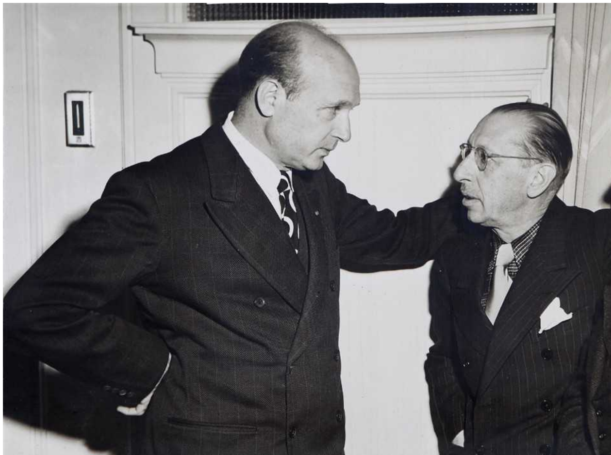
Сигети и Стравинский