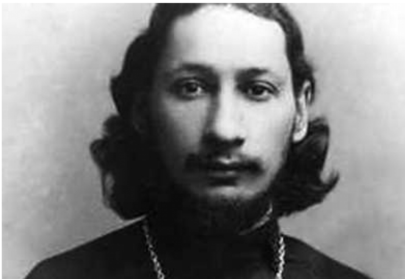
Отец Павел Флоренский

Автор: Жорж Нива (Пер. Н. Сикорской), Лозанна, 4. 03. 2013.