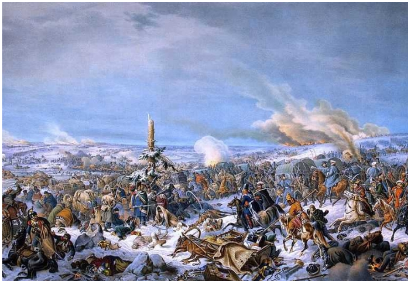
Петер фон Гесс, "Переправа через Березину"

Автор: Людмила Клот, Грюйер, 23. 11. 2012.