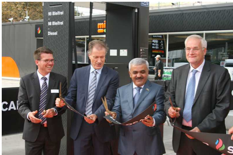
Дирекция Socar Energy Switzerland

состоит из шести человек, а всего здесь работает 900 сотрудников. Компания сохранила прежние рабочие места ExxonMobil и намерена создать новые. Кроме того, в конце июня компания Socar заключила договор со швейцарской торговой сетью Migros. Ее филиал Migrolino открыл на 55 заправочных станциях Socar свои магазины, в которых продаются продукты питания и необходимые водителям мелочи.