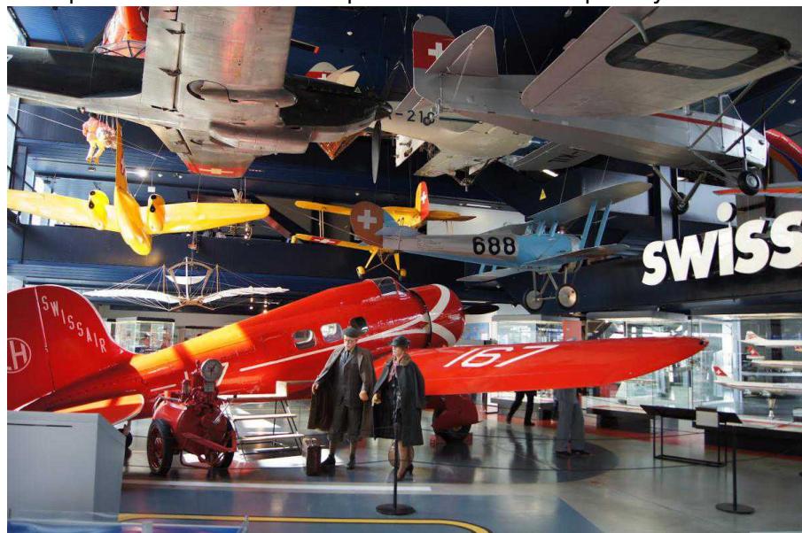
трамвайный симулятор с

Интерактивность – самая привлекательная черта музея. Чего только стоит