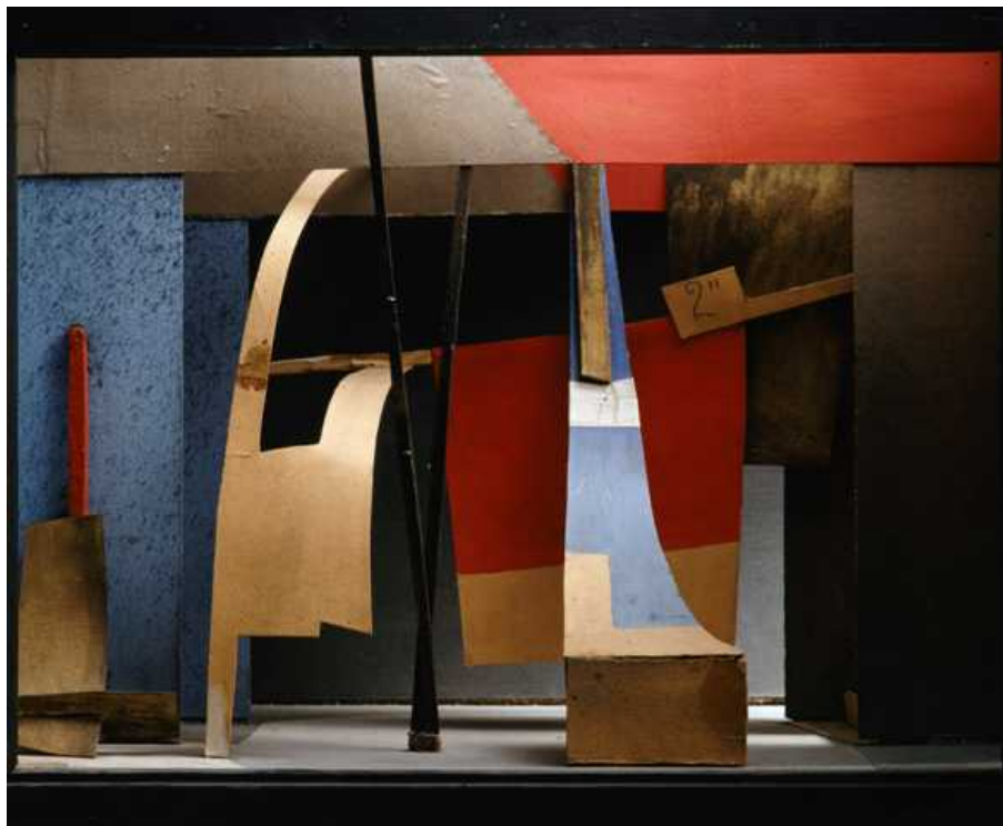
- Русское искусство со времен

реформ Петра Великого постепенно переориентировалось на европейские художественные стили. Это естественно, так как Россия – часть Европы, христианская страна. Но переняв европейскую традицию, наше искусство во многом утратило свою уникальность, восходящую к Средневековью, к иконописи Андрея Рублева, Феофана Грека и многих других. И хотя русская художественная школа во 2-ой половине XIX-го века сложилась уже как вполне самобытная (вспомним хотя бы передвижников), она осталась по сей день как бы вне интереса европейских исследователей и поэтому ее плохо знают на Западе.