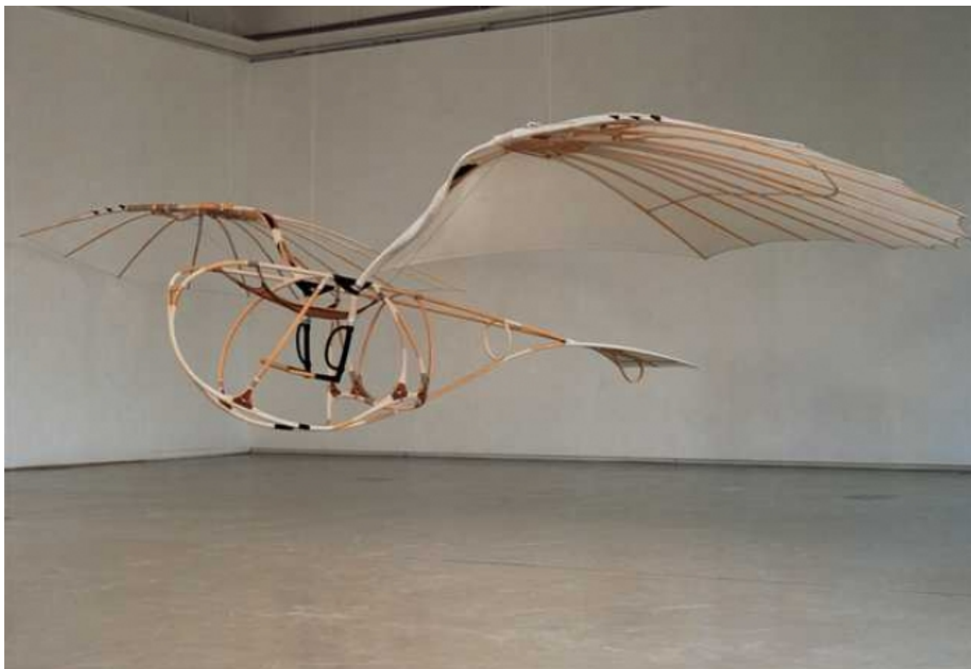
«Летатлин», 1929-1932.