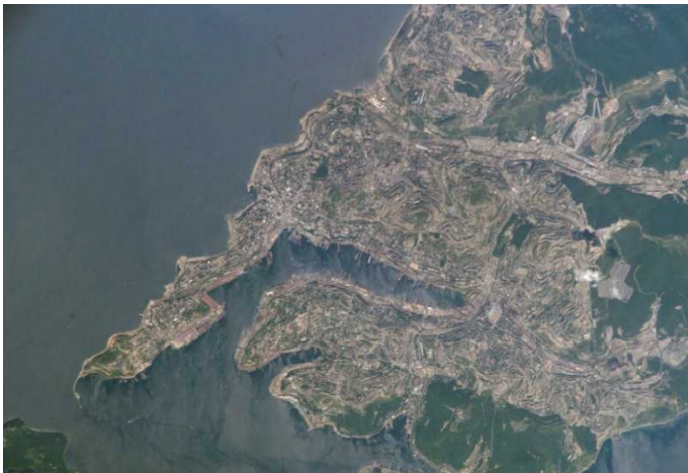
Владивосток, вид из космоса

Автор: Жорж Нива (Перевод Н. Сикорской), Женева, 10. 05. 2012.