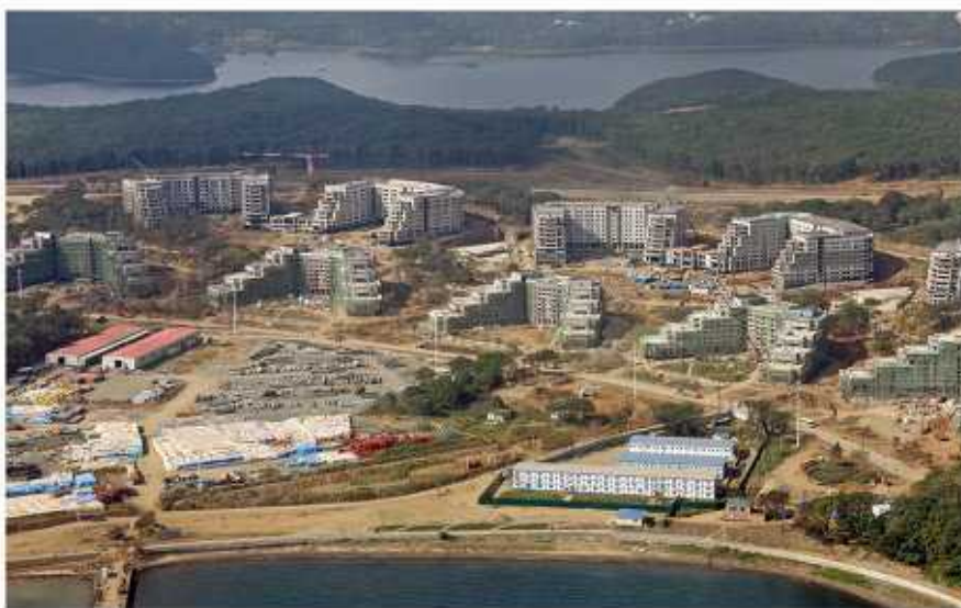
Дальневосточный федеральный университет

Владивосток, как и вся современная Россия, изголодался по своему прошлому: длинная эпистолярная лента Элеоноры, от американского викторианства жены коммерсанта-янки до этой пролетарской «коммуны» в доме Смитов, все это «река времен». Книга расходуется как горячие пирожки. При этом в городе не так много книжных магазинов! Зато я познакомился с владельцем «Табачного салона» - первого известного мне русского, читавшего Жюльена Грака, «Побережье Сирта»! Не много старинных домов сохранилось, но один красивый особняк указывает, что в нем родился актер Юл Бруннер. Религиозная жизнь не активна, но вновь действуют сверкающая церковь и лютеранский храм, которым руководит немецкий пастор и в котором дают концерты корейские дивы.