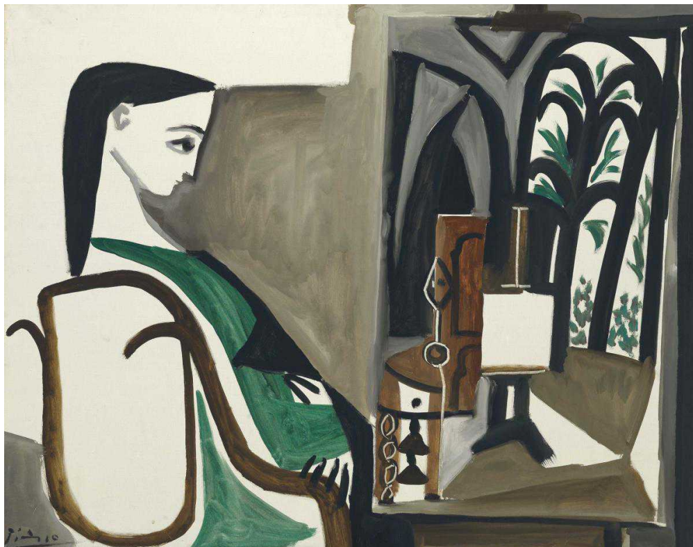
«FC 1 Ива Кляйна имеет

такое же значение для Европы, как Number One Поллока для Америки, - заявляет Лоик Гузер, международный эксперт по послевоенному и современному искусству. – Эта последняя работа объединяет все элементы, которым научился Кляйн на протяжении его короткой, но интенсивной карьеры. FC 1 в совершенстве отражает навязчивое стремление Кляйна к воплощению концепции несовместимого единства присутствия и отсутствия, жизни и смерти; эта работа оказала огромное эмоциональное и физическое воздействие на самого художника.»