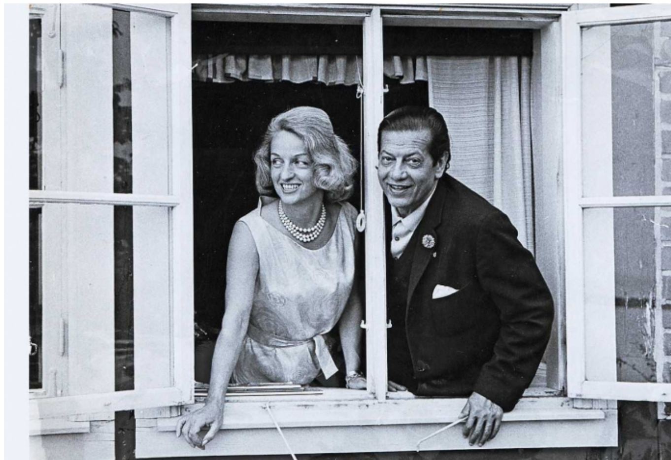
Серж Лифарь и графиня Лаллан Алефельд-Лорвиг

Автор: Людмила Клот, Женева, 16. 03. 2012.