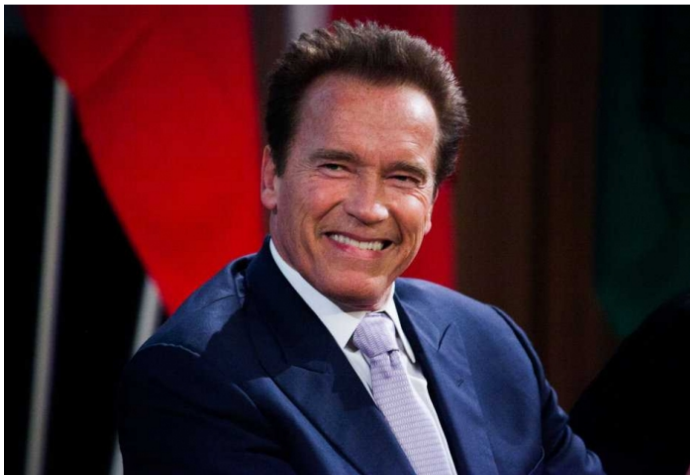
Арнольд Шварценнегер в Женеве

Автор: Азамат Рахимов, Женеве, 9. 03. 2012.