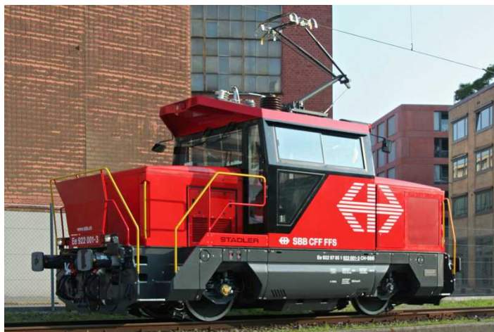
Маневренный электрический локомотив Ee

Так, платформы двух железных дорог отныне расположены логичным образом, и большой подземный переход пересекает вокзал, открывая удобные выходы к путям. Само здание было расширено и отреставрировано в стиле минималистской архитектуры, перепланировке подверглась и вокзальная площадь. Неслучайно вокзал Кура с современной инфраструктурой получил высокую оценку швейцарской Ассоциации транспорта и окружающей среды как образец комфортабельности и гармоничной архитектуры .