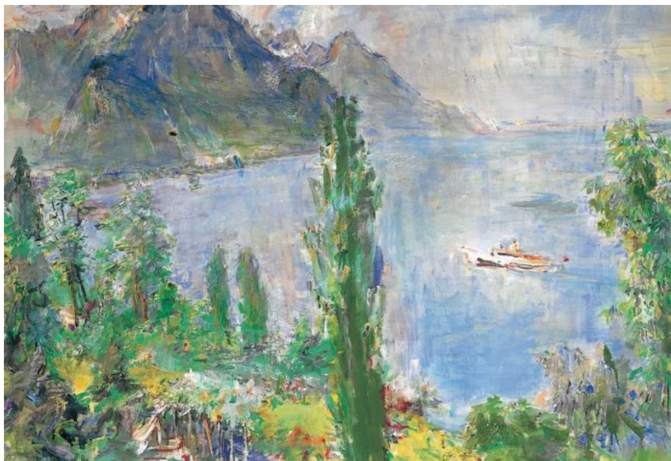
Оскар Кокошка, "Пароход на Женевском озере", 1957