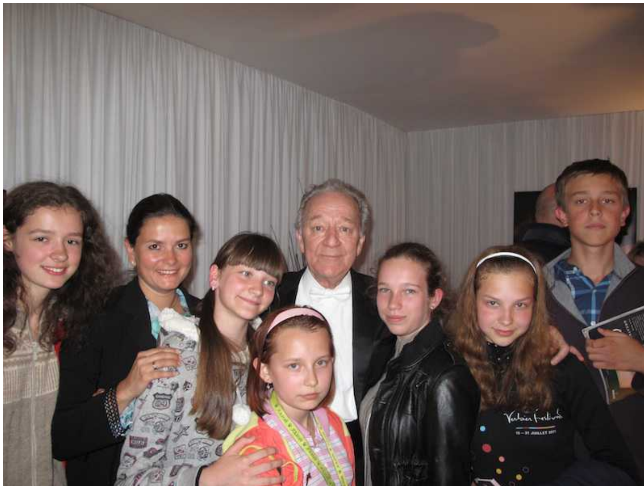
Юрий Темирканов и дети