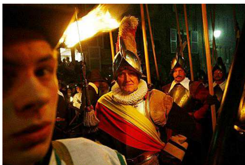
Жительница Фрибурга 38-летняя