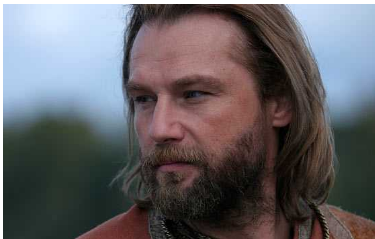
«Ярослав. Тысячу лет назад» -

герои противостоят фашистам и выступающим на их стороне призракам рыцарей Ливонского ордена, пытаясь переломить ход войны. Показанный в 2009 году в Каннах и на Московском Международном Кинофестивале, фильм привлек внимание не только ловко закрученным сюжетом, но и необыкновенной стилистикой, накладывающей эстетику японских манга на советские реалии.