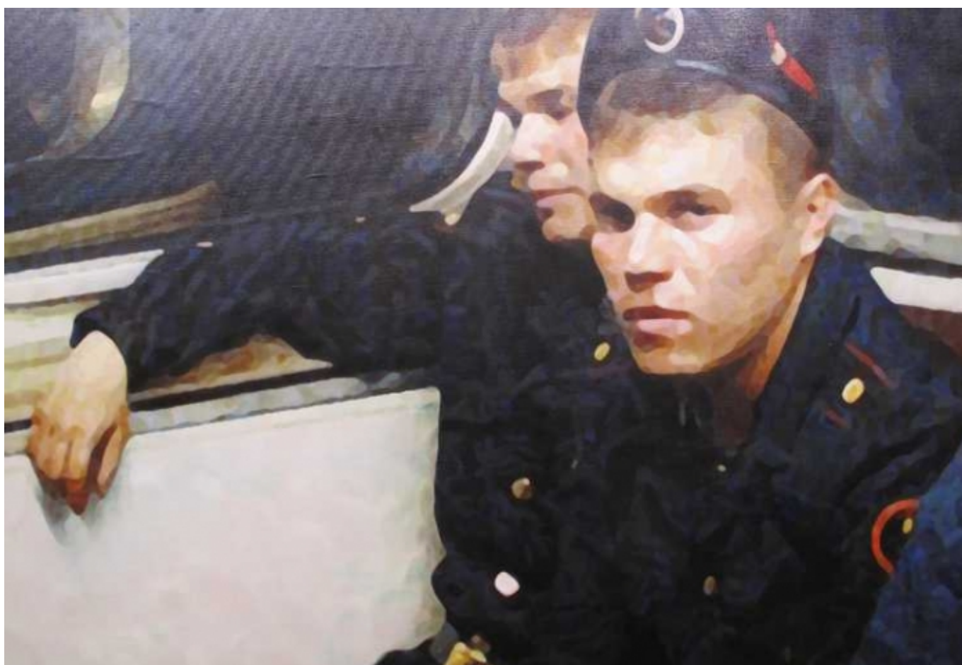
С. Файбисович «В метро» (© все фото - автора/НГ)

Автор: Андрей Федорченко, Базель, 17. 06. 2011.