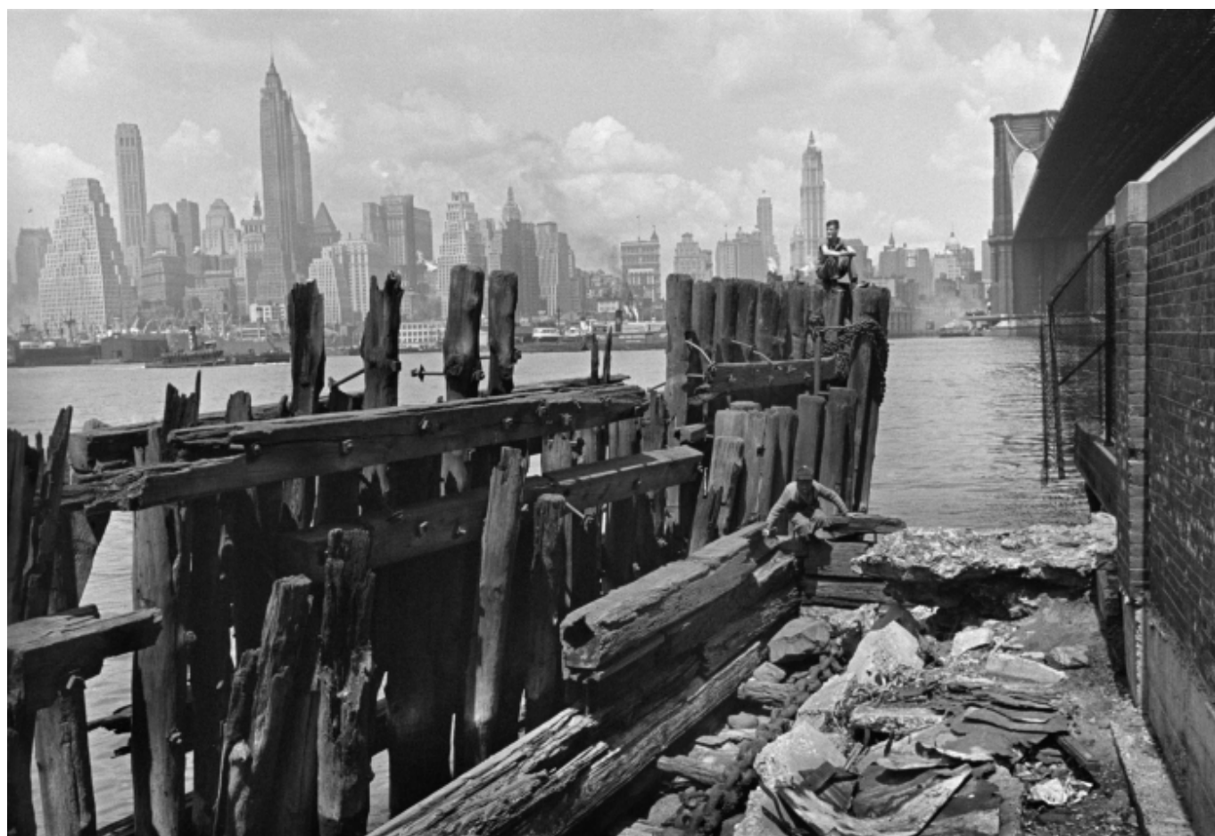
Анри Картье-Брессон, Нью-Йорк Сити, 1947

Автор: Ольга Юркина, Цюрих, 28. 04. 2011.