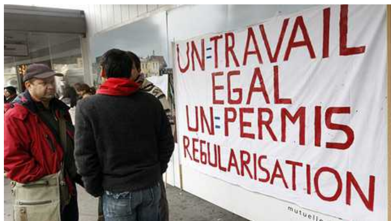
«Разница в восприятии нелегалов в

О различиях в подходе к налогообложению мы писали уже неоднократно и, в конце концов, большая часть категории лиц, которых она касается, имеют выбор. А что делать тем, у кого выбора нет, например, оказавшимся в Швейцарии нелегалам, без документов и без средств к существованию, так называемым «sans-papier»?