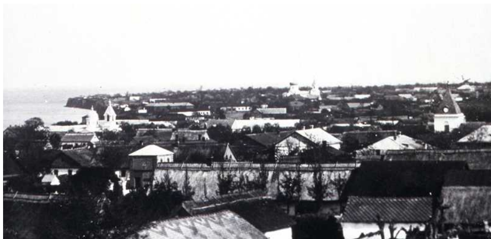
Поселенцы получили по 78

Будущие колонисты на подводах пересекли всю Швейцарию, через Баварию проследовали в Вену, затем в Польшу, чтобы через более чем через три месяца достичь, наконец, «виноградной широты». Официальным днем рождения водуазского поселения Шабаг считается день прибытия сюда колонистов, 10 ноября 1822 года.