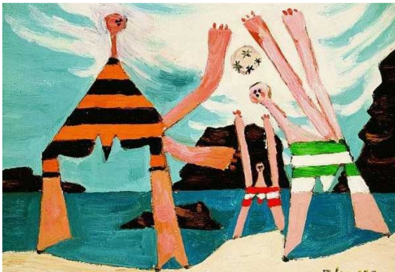
Пабло Пикассо, Купающиеся с мячом, 1928 г. (© ProLitteris, Zürich)

Автор: Ольга Юркина, Цюрих, 15. 10. 2010.