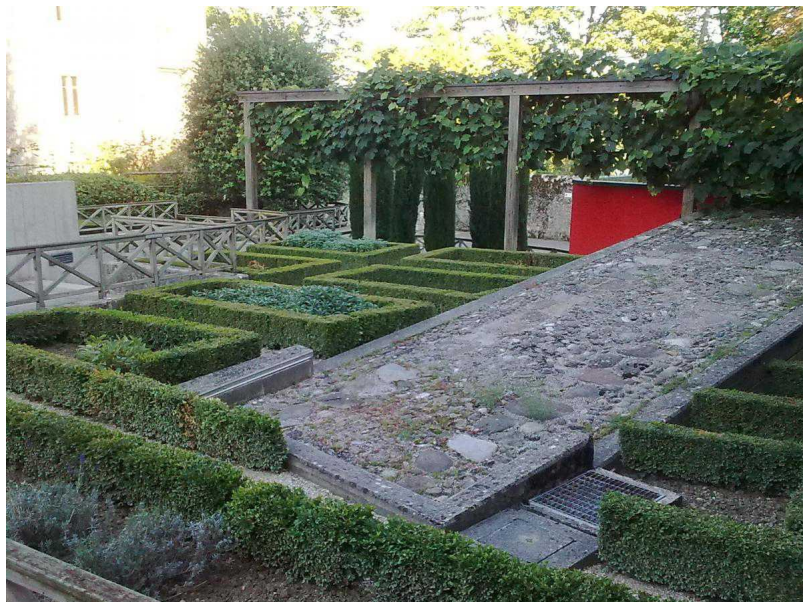
Около памятника знаменитому

полководцу нионцы разбили миниатюрный «Римский сад» - все представленные здесь деревья и кустарники возделывались древними римлянами в античную эпоху. Еще на заре европейской цивилизации частные и общественные сады Новиодунума украшали лекарственные растения, кусты - кулинарные специи, селекционные декоративные цветы, которыми мы сейчас можем полюбоваться в Римском саду. Специальная табличка гласит: «Merci de ne pas entrer dans le jardin!» (Просьба не заходить на территорию сада!)