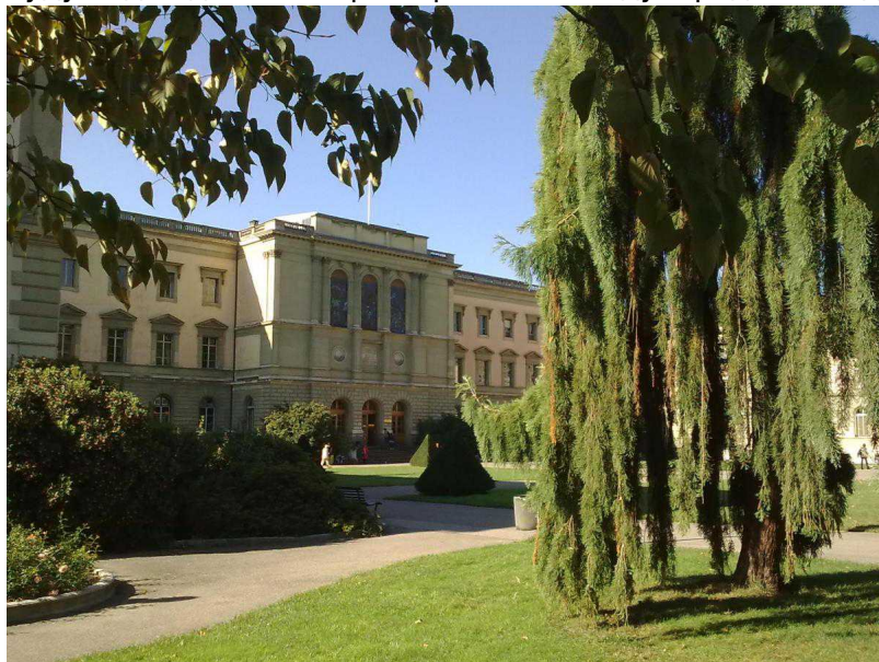
Октябрь - вид на Университет

Бастионов – это женевский вариант парижского латинского квартала. А Стена Реформаторов в парке – не только обязательный пункт туристических маршрутов, но и место проведения, например, группных занятий йогой или цирковых представлений, которые шли здесь все лето (и будут идти до 8 октября) в рамках Международного года цирка.