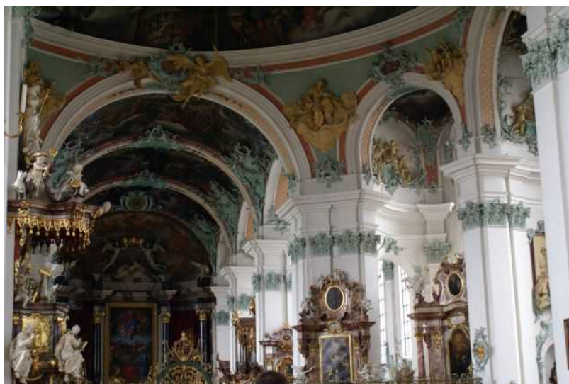
История монастырских садов Санкт-

Между 1758 и 1767 годом, во время управления монастырем настоятелей Кёлестина Гуггера фон Штаудаха и Беды Ангерна, было построено хорошо известное сегодня и внесенное в Список Всемирного наследия ЮНЕСКО барочное здание библиотеки и собора, один из самых красивых архитектурных ансамблей этого архитектурного стиля. В то же время во внутренних дворах и вокруг аббатства было разбито еще больше роскошных садов.