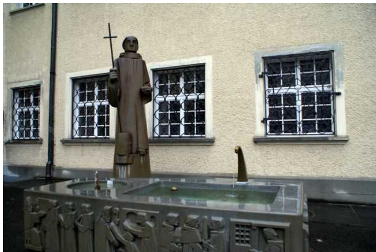
Основанный в 612 году, монастырь в 747

году, при аббате-настоятеле Отмаре, последователе Святого Галлуса, принимает Бенедиктинский устав, предполагающий, помимо прочего, занятия наукой, литературой и искусством. Если своего средневекового расцвета аббатство достигает в период Каролингского возрождения, то еще при Пипине Коротком, отце Карла Великого, Отмар открывает здесь первые школы письменности и скрипторий.