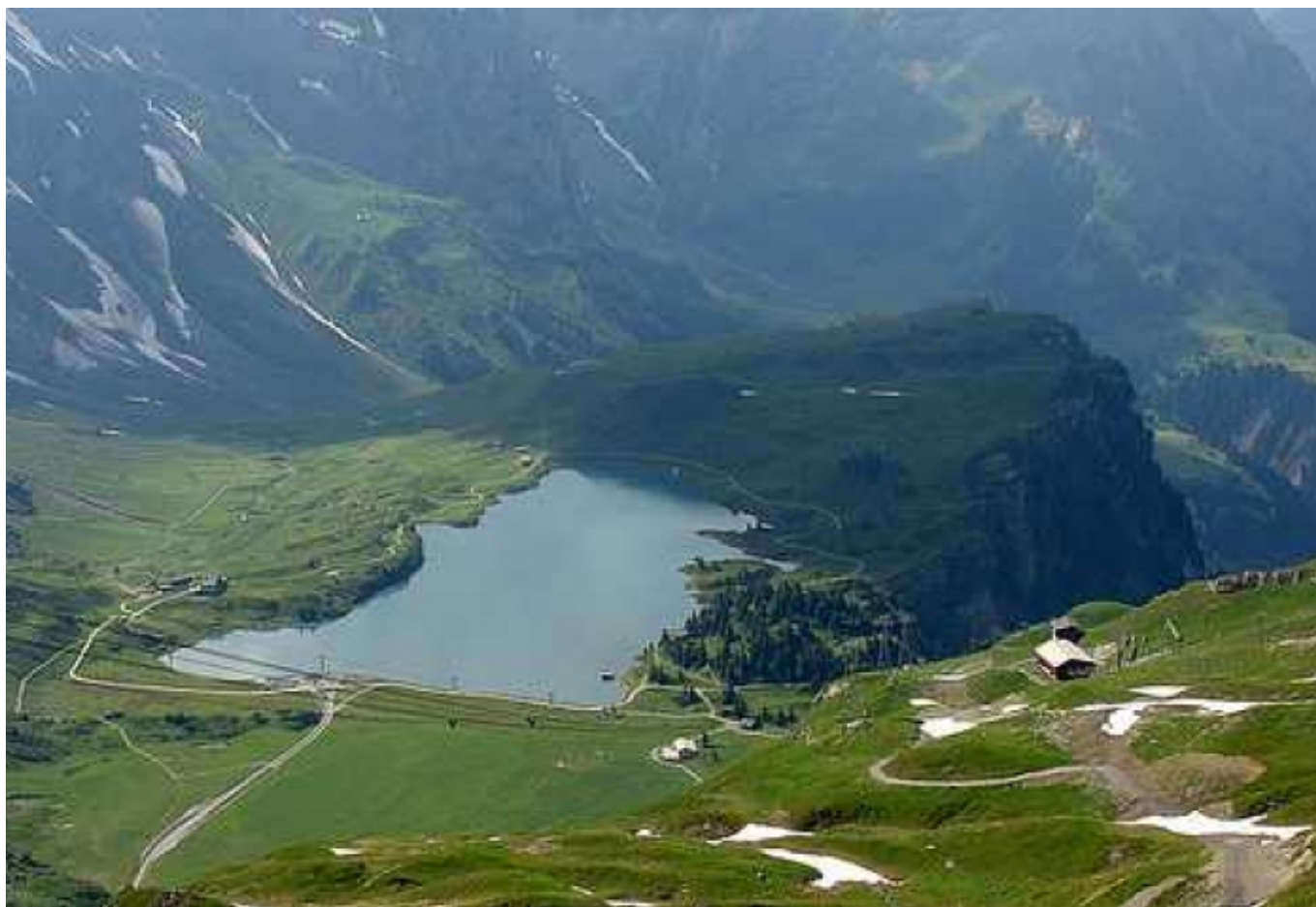
Горное озеро Трубзее

Автор: Иван Горовенко, Энгельберг, 1. 10. 2010.