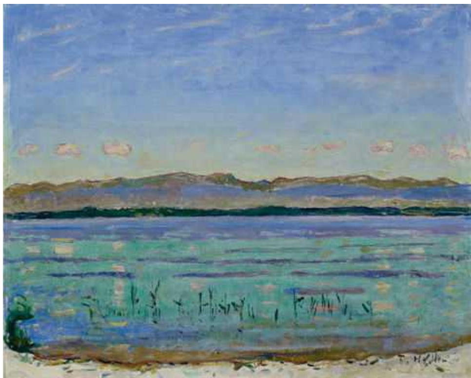
Фердинанд Ходлер, «Genfersee mit Jura» (1911)

Автор: Людмила Клот, Цюрих , 09.06.2010.