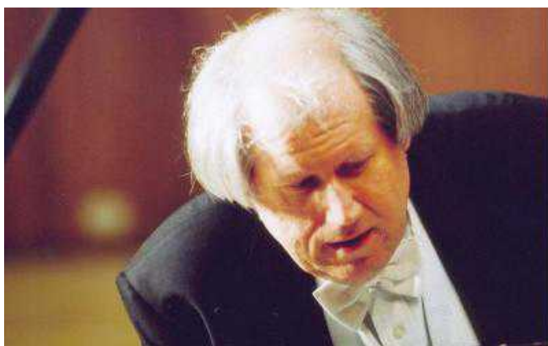
Пианист Григорий Соколов

Автор: Надежда Сикорская, Монтре , 23.04.2010.