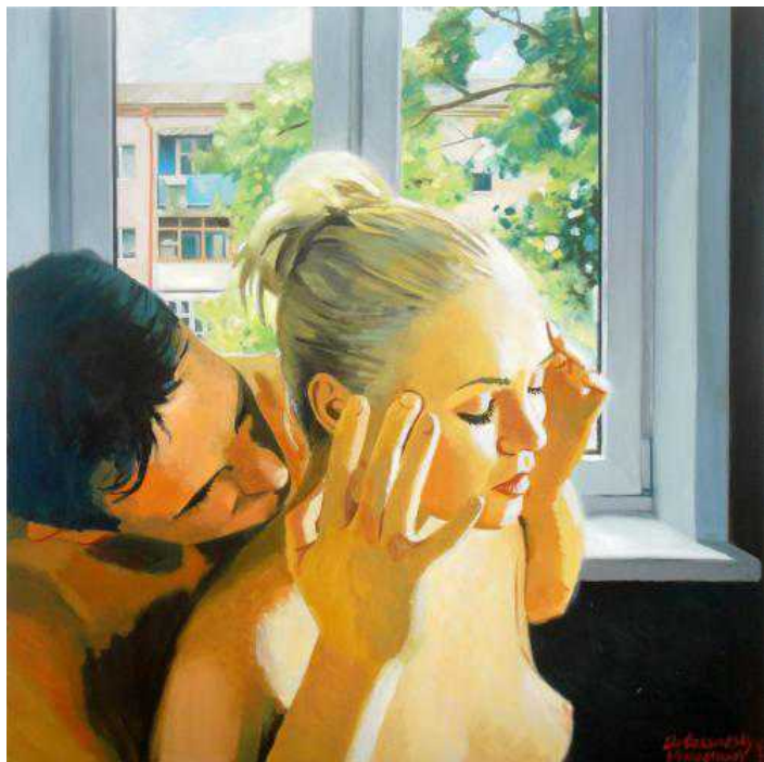
Erotica.ru, 2010 [Moser Concept]

Именно соцреалистического, а не советского, ибо речь шла не о критике социалистического мышления (хотя между делом ему тоже доставалось), а о пародии на эстетические трафареты, все еще хорошо узнаваемые в новорожденной демократической стране.