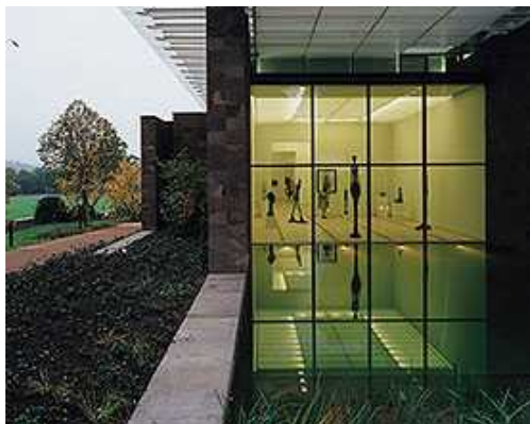
Музей в Рихене: сквозь стекло просвечивает Джакометти

В период с 1959 по 1965 годы Бейелер пошел ва-банк, приобретя часть коллекции Томпсона из Питтсбурга: 100 работ Клее (сегодня 88 из них находятся в Собрании произведений искусства Северной Вестфалии, Дюссельдорф). А также 340 произведений Сезанна, Моне, Пикассо, Матисса, Миро, Мондриана, Брака, и кроме них, 80 статуэток Джакометти (сейчас их можно увидеть в Фонде Джакометти в Цюрихе и в Музее искусств в Базеле). Сам Бейелер признавался, что вдохновил его тогда бум на покупку современного искусства. Кстати, выбирая картины, он руководствовался исключительно собственным вкусом, и даже не всегда мог объяснить, почему приобретает ту или иную работу и оставляет без внимания другую. «Он покупал только лучшие произведения из лучших и стал настоящим «современным классиком» среди собирателей искусства», - считают коллеги по цеху.