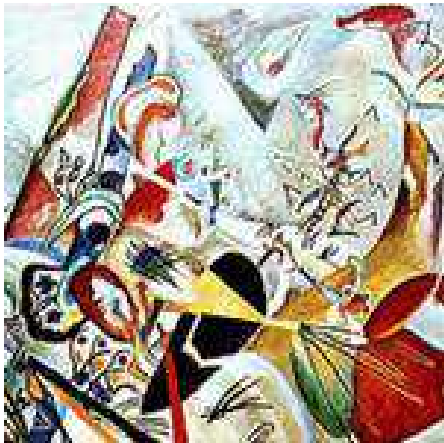
Кандинский "Импровизация номер 10"