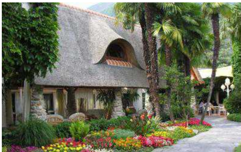
Отель Albergo Losone в Асконе

Автор: Людмила Клот, Женева , 09.06.2009.