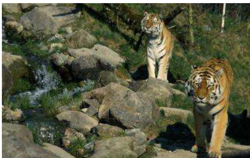
Амурские тигры

Автор: Людмила Клот, Цюрих , 26.12.2008.