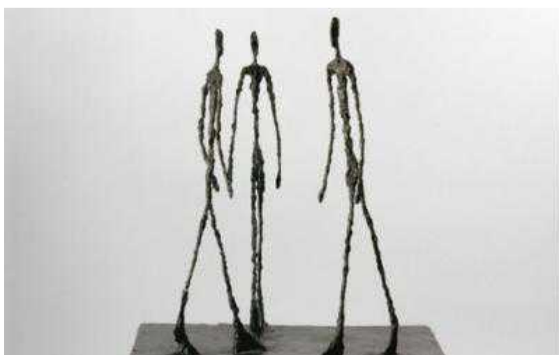
Альберто Джакометти, "Трое идущих I"

Автор: Надежда Сикорская, Женева , 18.09.2008.