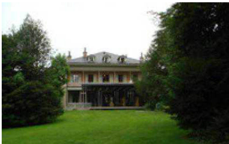
Здание Fondation L'Hermitage в Лозанне, 18 в. (© А. Tikhonov)

Автор: Александр Тихонов, Лозанна , 11.08.2008.