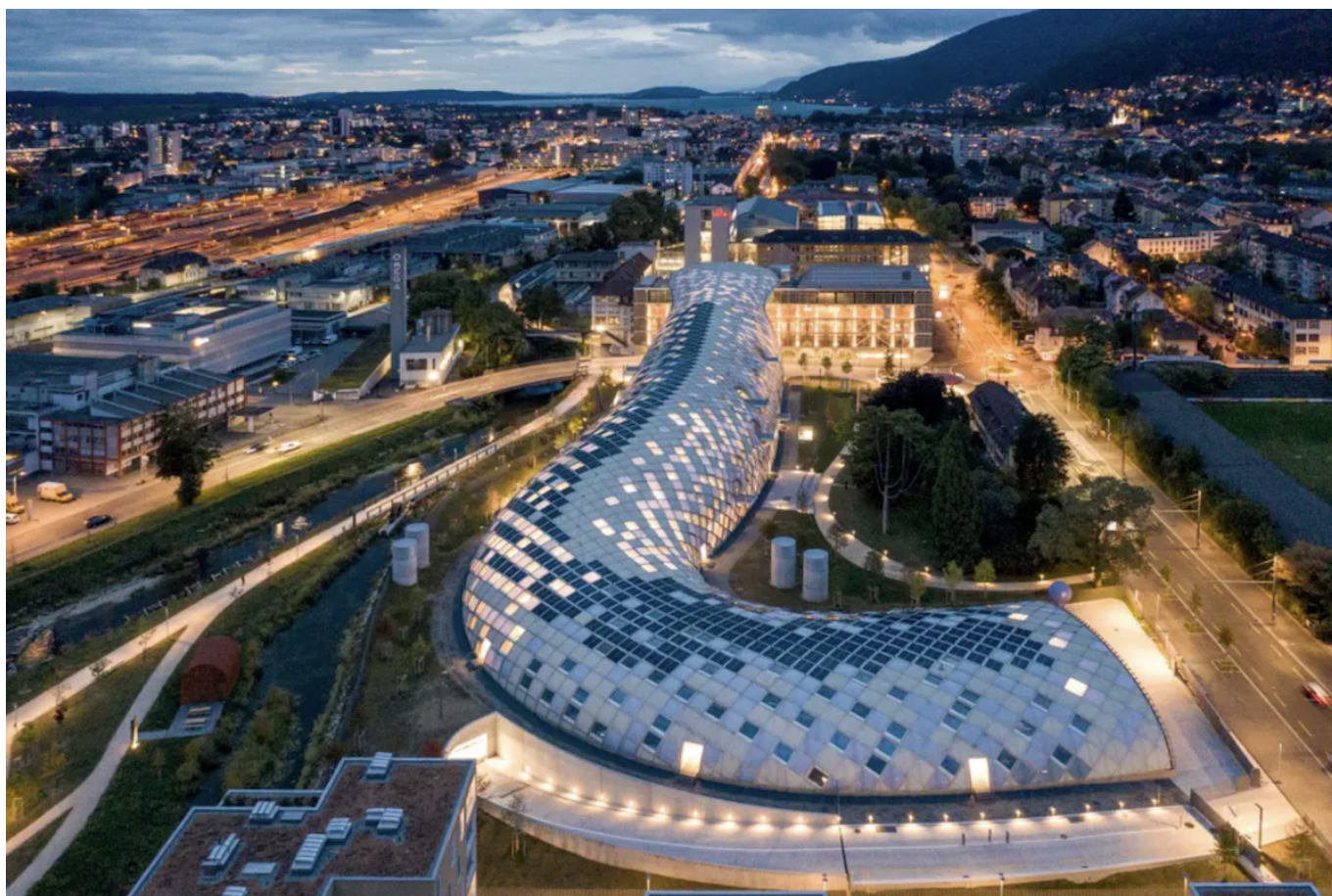
Штаб-квартира Swatch Group в Биле

Как швейцарские производители часов реагируют на спад объемов продаж? И как они адаптируются к изменениям рынка?