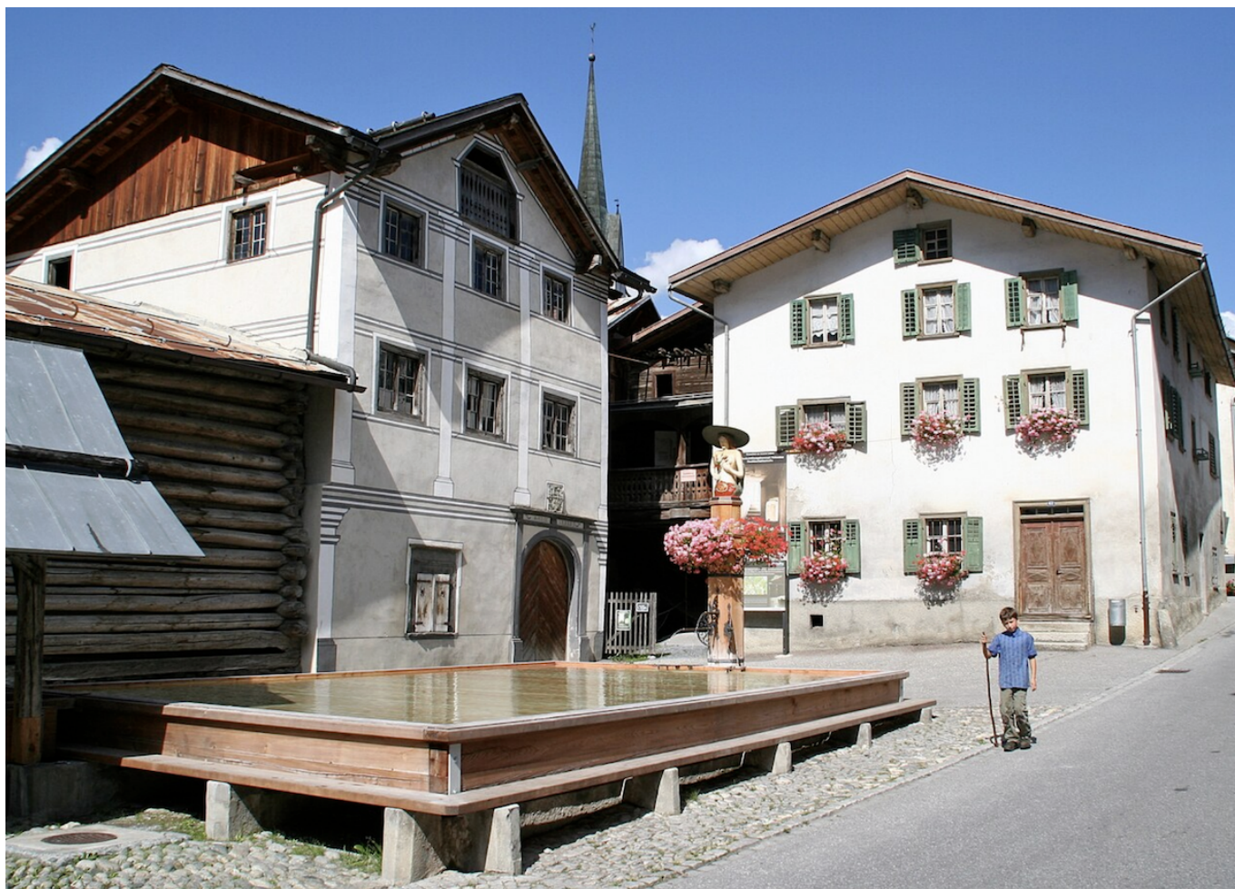
Фото: Adrian Michael, Wikimedia Commons

Автор: Заррина Салимова, Валендас , 28.10.2025.