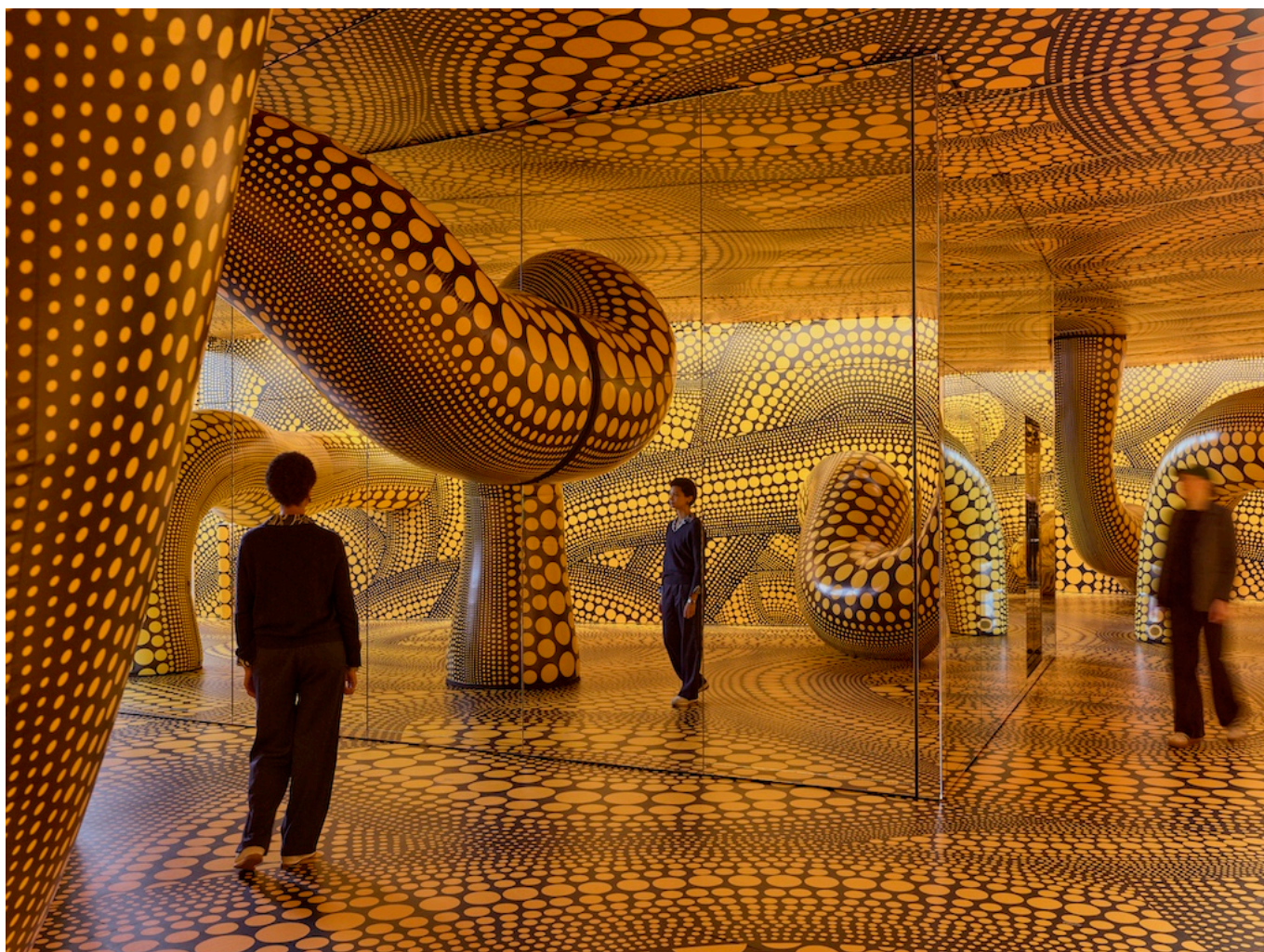
Инсталляция Infinity Mirrored Room – The Hope of the Polka Dots Buried in Infinity Will Eternally Cover the Universe, 2025 © YAYOI KUSAMA

Автора этих строк больше всего впечатлили, пожалуй, гигантские полотна Кусамы, расписанные невероятным количеством точек или, вернее, сверху донизу ими заполненные. На создание этих работ, ознаменовавших кардинально новый этап в ее творчестве, художницу подтолкнуло путешествие через океан, когда она в конце 1950-х годов, бросив свою обеспеченную, но неблагополучную семью, отважно полетела из родной Японии в США, чтобы лично познакомиться с вдохновлявшей ее Джорджией О'Кифф, выставка которой проходила здесь же, в Фонде Бейлера, три года назад . В Соединенных Штатах Кусاما тогда задержалась на полтора десятка лет, став важнейшей фигурой местной художественной сцены и впервые прославившись своими перформансами, хеппенингами, протестными акциями (в том числе с сжиганием советского флага), живописью, скульптурами, ассамбляжами и изготовлением моделей одежды.