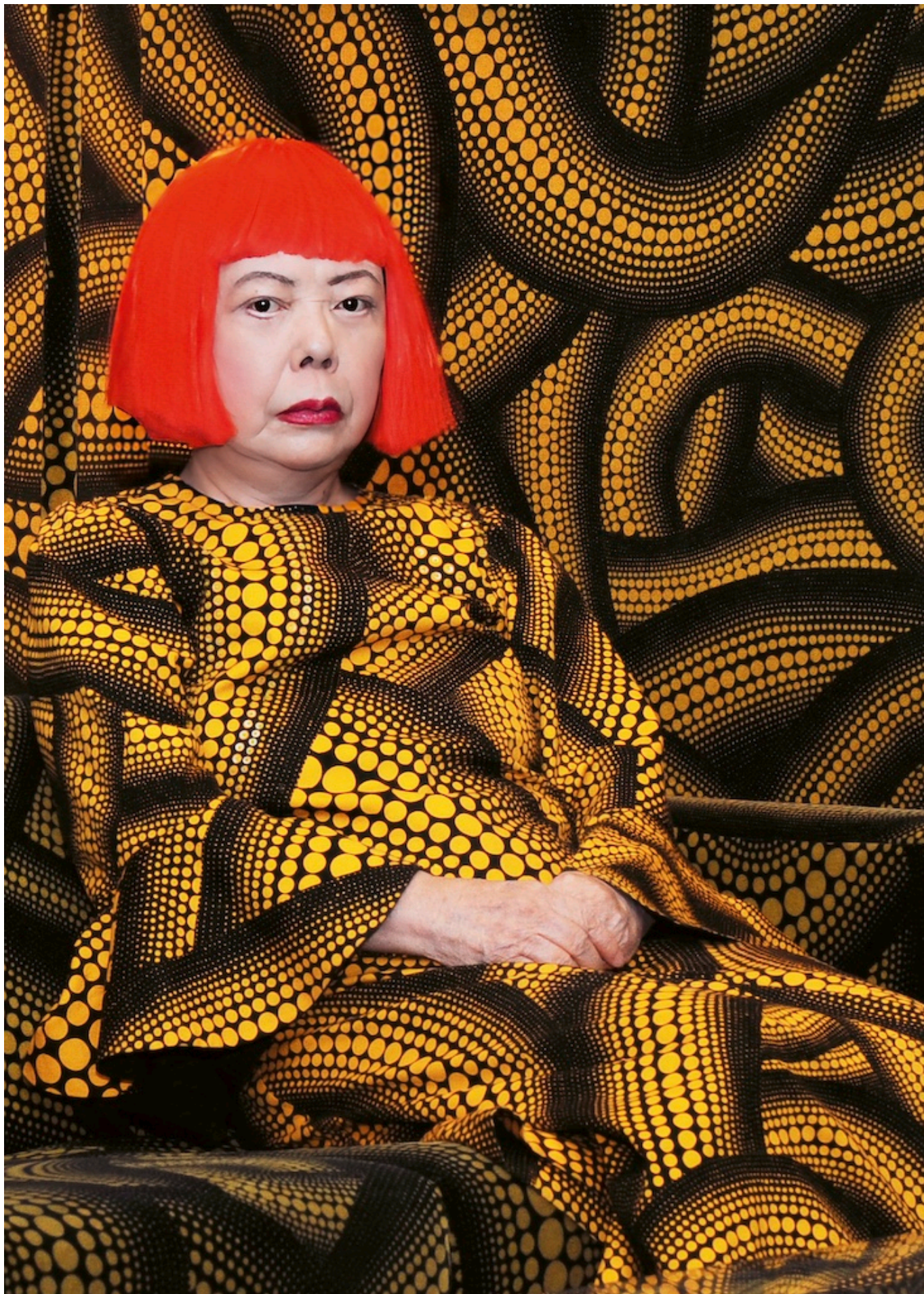
Кусама с желтым деревом/ Гостиная в стиле TRIENNALE D'AICHI, 2010 г. © YAYOI KUSAMA, Courtesy of Ota Fine Arts, Victoria Miro, David Zwirner