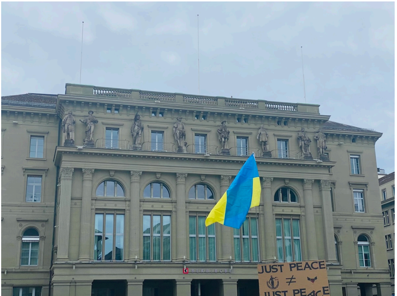
Фото сделано 22 февраля 2025 года во время акции, приуроченной к годовщине начала войны.

Автор: Заррина Салимова, Берн , 13.10.2025.