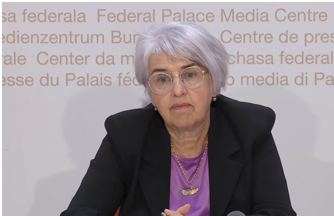
Элизабет Бом-Шнайдер. Скриншот трансляции пресс-конференции от 23 сентября 2025 года