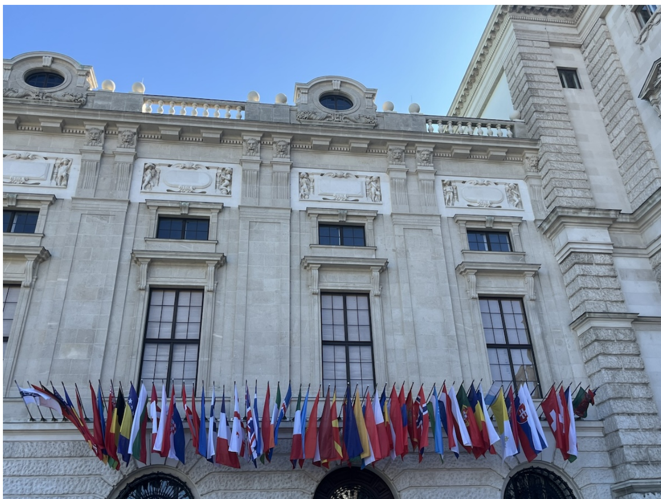
Штаб-квартира ОБСЕ в Вене.

Автор: Заррина Салимова, Берн-Вена , 11.08.2025.