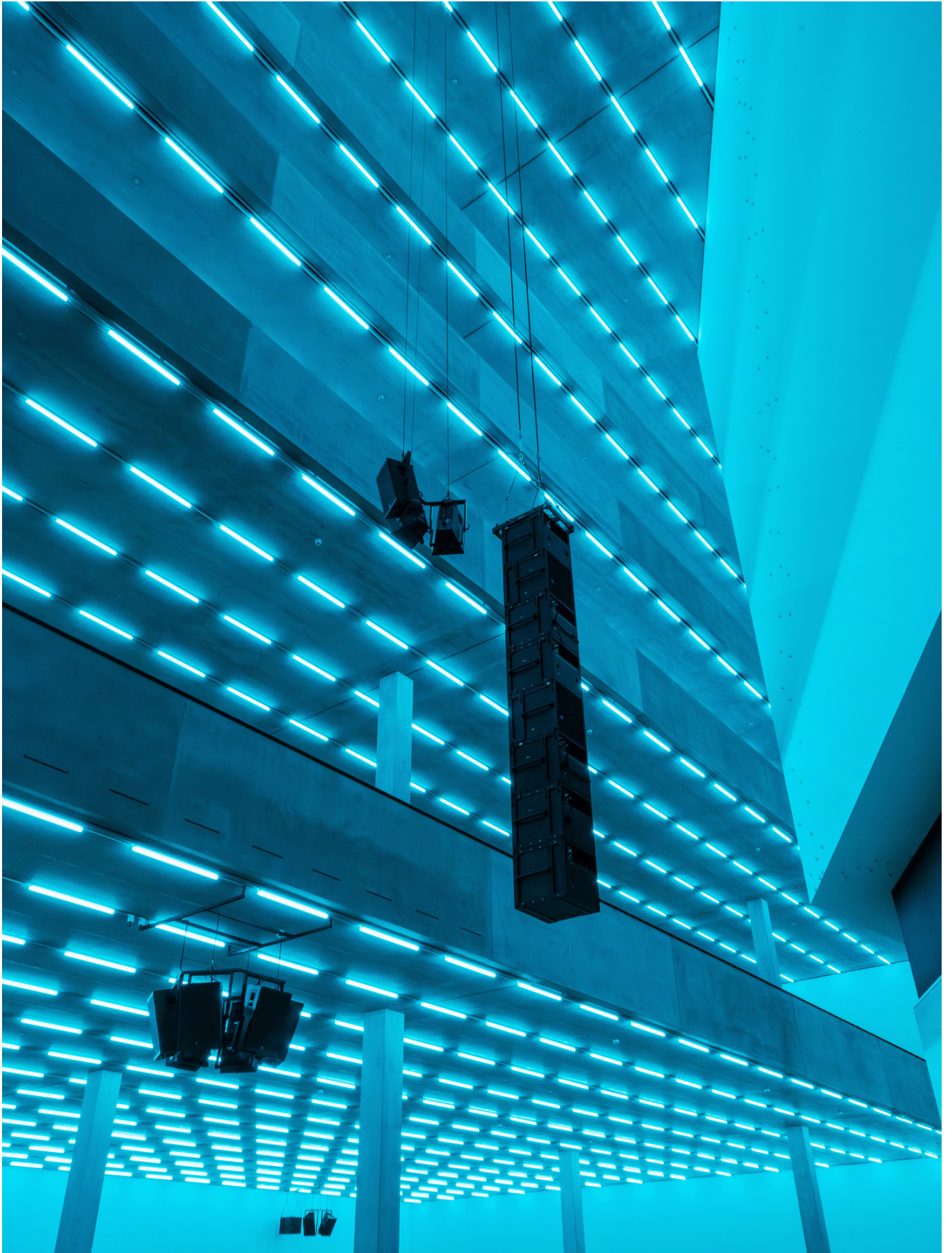
Steve McQueen, Bass, 2024, LED Light and Sound, Courtesy the artist, Co-commissioned work by Laurenz Foundation, Schaulager Basel and Dia Art Foundation, 15 June – 16 November 2025, Schaulager® Münchenstein/Basel (Installation view), Photo: Pati Grabowicz