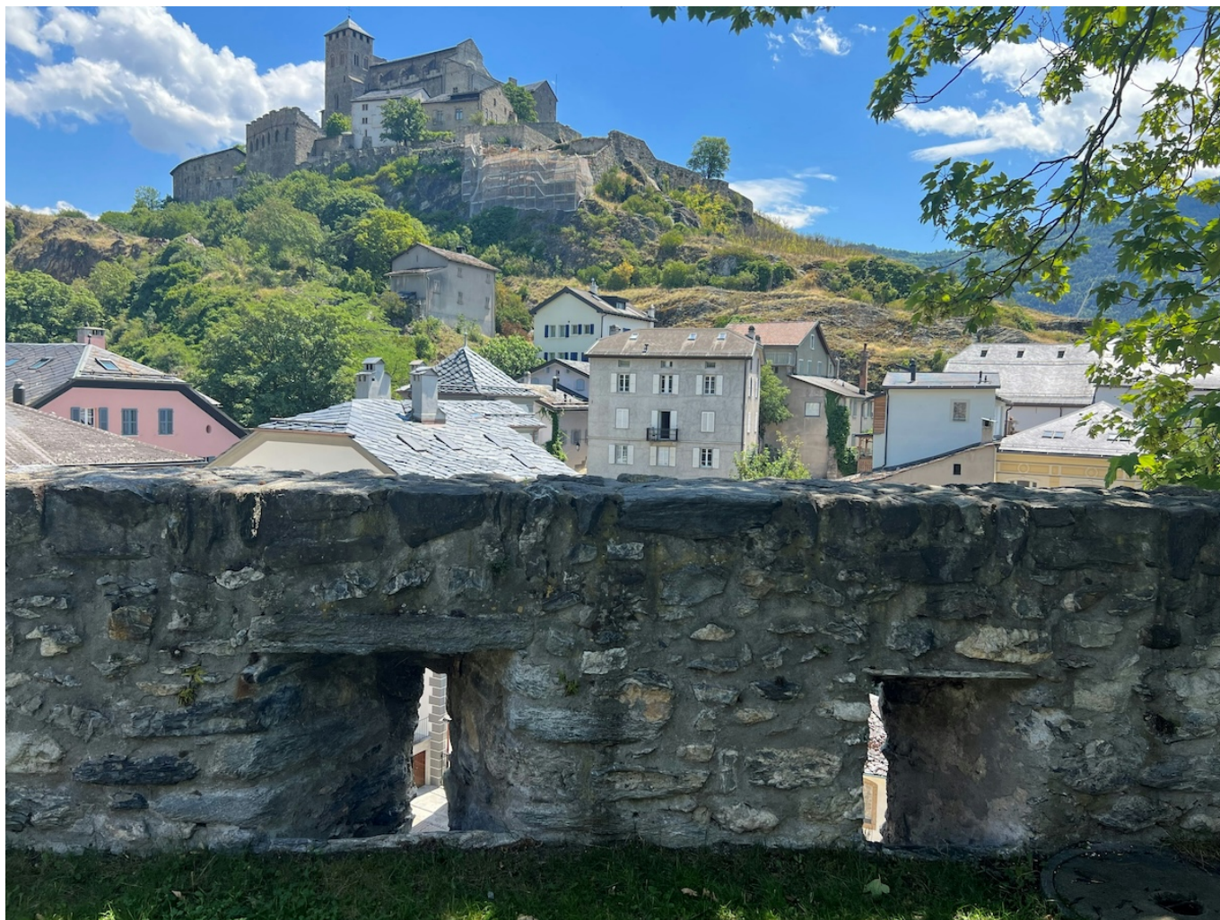
Суровой Сион – столица кантона Вале.

Автор: Заррина Салимова, Сион , 02.07.2025.