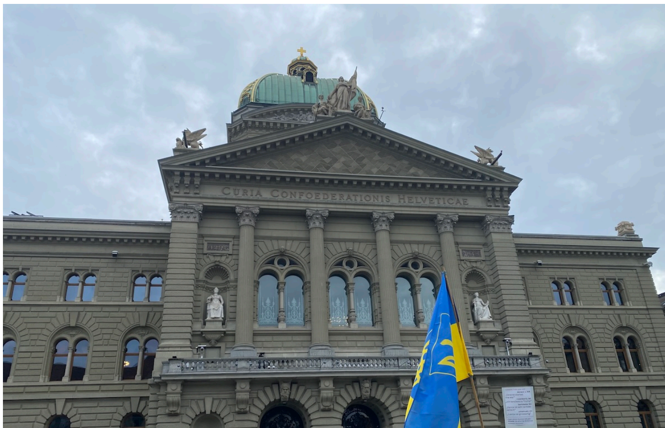
Фото сделано 22 февраля 2025 года во время акции, приуроченной к годовщине начала войны.

Автор: Заррина Салимова, Берн , 26.06.2025.