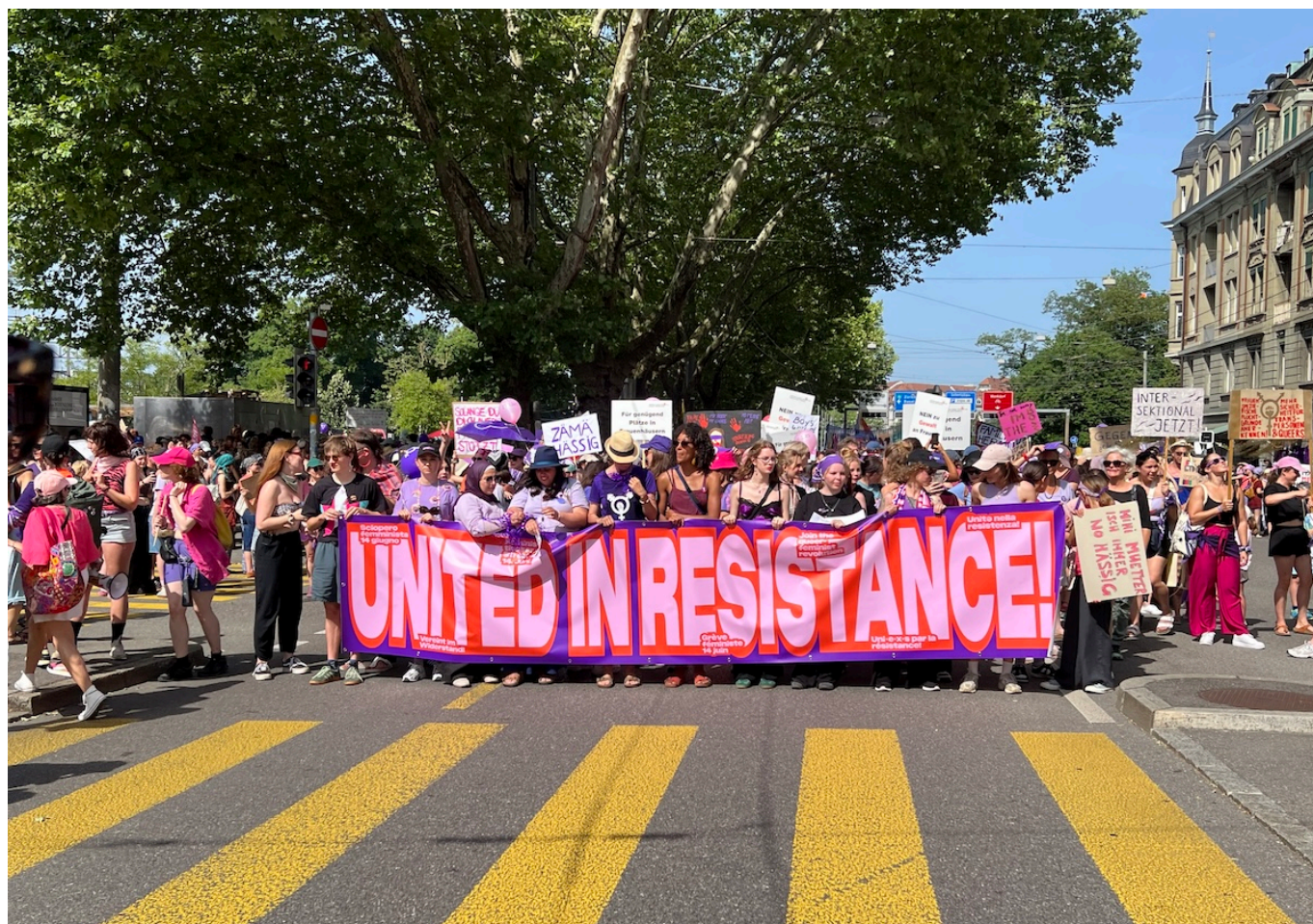
Феминистская забастовка в Берне.