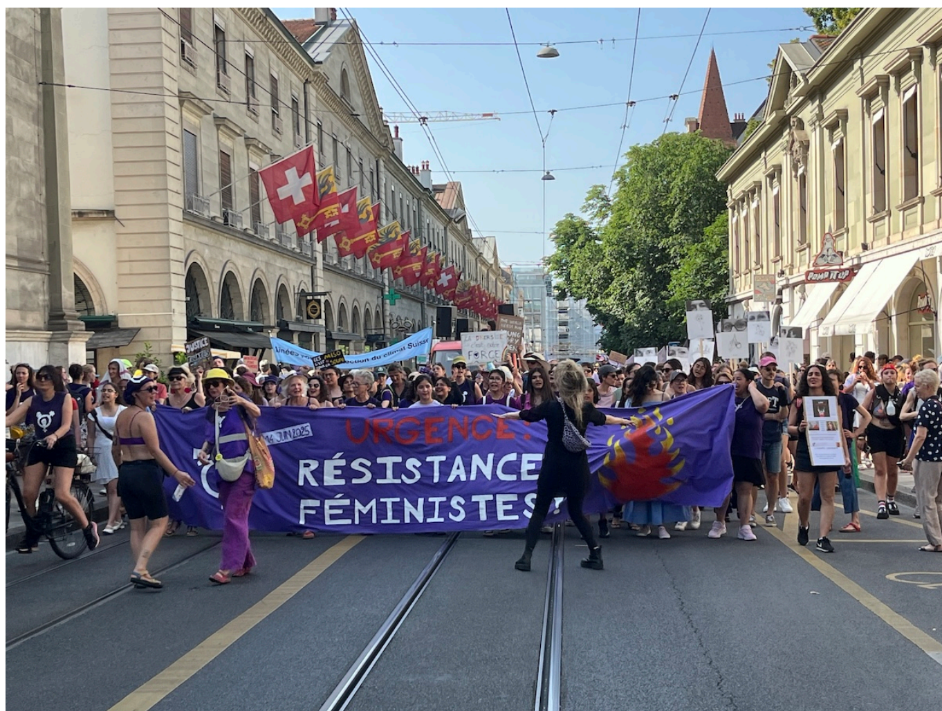
Забастовка в Женеве.

В забастовке, которая прошла в прошлую субботу в двух десятках швейцарских городов, приняли десятки тысяч человек. Так, на митинг в Базеле собралось около 5 000 человек. В Цюрихе около десяти тысяч человек прошли маршем по центру города. В Женеве полиция насчитала 3 500 участников, а в забастовке во Фрибурге, по оценкам организаторов, приняли участие 3 000 женщин, транс- и небинарных людей, а также солидарных мужчин. В Лозанне вместо шествия состоялось большое собрание на одной из площадей. Митинг в Сионе был направлен, в частности, против насилия в отношении женщин.