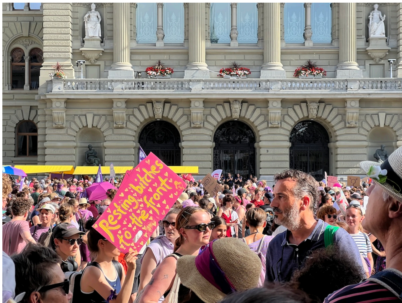
Забастовка в Берне.

Шютценматте через центр города к Федеральному дворцу. Девизом бернского забастовочного коллектива были слова «Объединенные в сопротивлении». Протестующие почтили минутой молчания память обо всех женщинах и квирах, пострадавших от патриархального и сексуализированного насилия по всему миру. В толпе были замечены женщины самых разных поколений – от пожилых дам, гордо несущих транспаранты «Революция бабушек», до совсем маленьких девчушек с плакатами «Моя мама все еще в гневе».