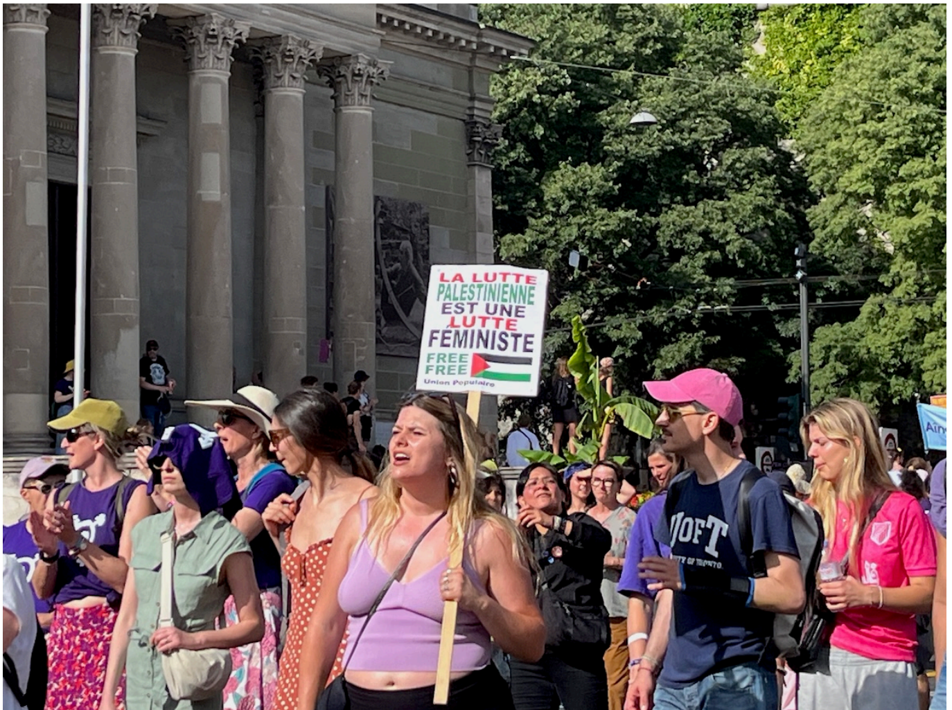
Забастовка в Женеве.

Однако именно инклюзивности не хватило некоторым организаторам акции в Романдии. В коммюнике, распространенном Координационным советом против антисемитизма и диффамации (CICAD), сообщается о том, что несколько забастовочных коллективов во франкоязычной Швейцарии посчитали нежелательным участие «сионисток» и тех, кто носит звезду Давида. Под запрет попали и флаги ЛГБТК+ со звездой Давида. При этом в пятницу вечером в Лозанне состоялась несанкционированная демонстрация нескольких феминистских и леворадикальных групп, которые вместе с плакатами «Феминизм! Антикапитализм!» несли транспаранты «Free Palestine». Пропалестинские лозунги и палестинские флаги присутствовали и на субботней акции в Женеве. Приветствуя приверженность феминисток борьбе со всеми формами угнетения, CICAD подчеркнул, что эта борьба не может строиться на молчании перед лицом таких зверств, как изнасилования, пытки и убийства израильских женщин во время атаки ХАМАСа 7 октября 2023 года. CICAD призвал организаторов феминистской забастовки не превращать борьбу за равенство в инструмент исключения и не выделять женщин по признаку их идентичности.