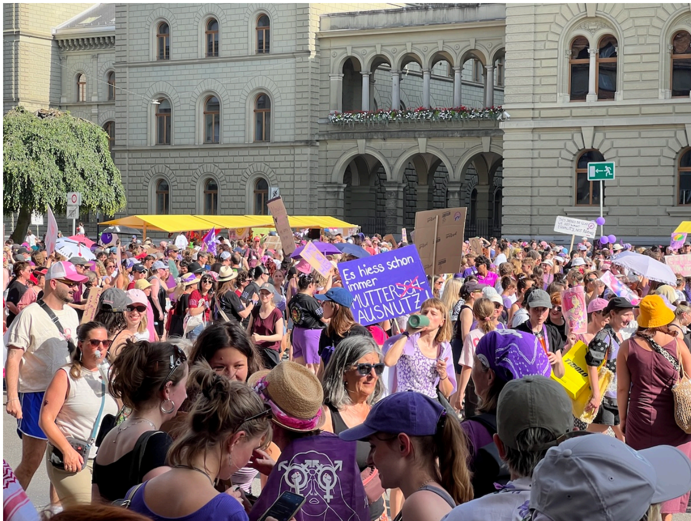
Плакат в защиту материнства на Федеральной площади в Берне.

Кроме того, традиционные «женские» профессии в Швейцарии оплачиваются невысоко. Более половины женщин зарабатывают менее 4 200 франков в месяц, а четверть – 2 500 франков и менее. Такие низкие зарплаты обусловлены не только неполной занятостью, но и структурными недостатками. Женщины также реже получают 13-ю зарплату, что создает дополнительную нагрузку на их финансы. Активистки требуют установления зарплаты на уровне не менее 4 500 франков, а при прохождении обучения – не менее 5 000 франков.