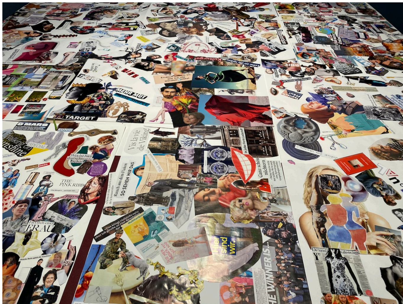
Часть коллажа, составленного посетителями выставки «Frauen(k)leben».

За что же борются швейцарские феминистки? За достижение равенства, до которого еще далеко. Особенно сейчас, когда правые силы по всему миру ведут наступление на политику равенства.