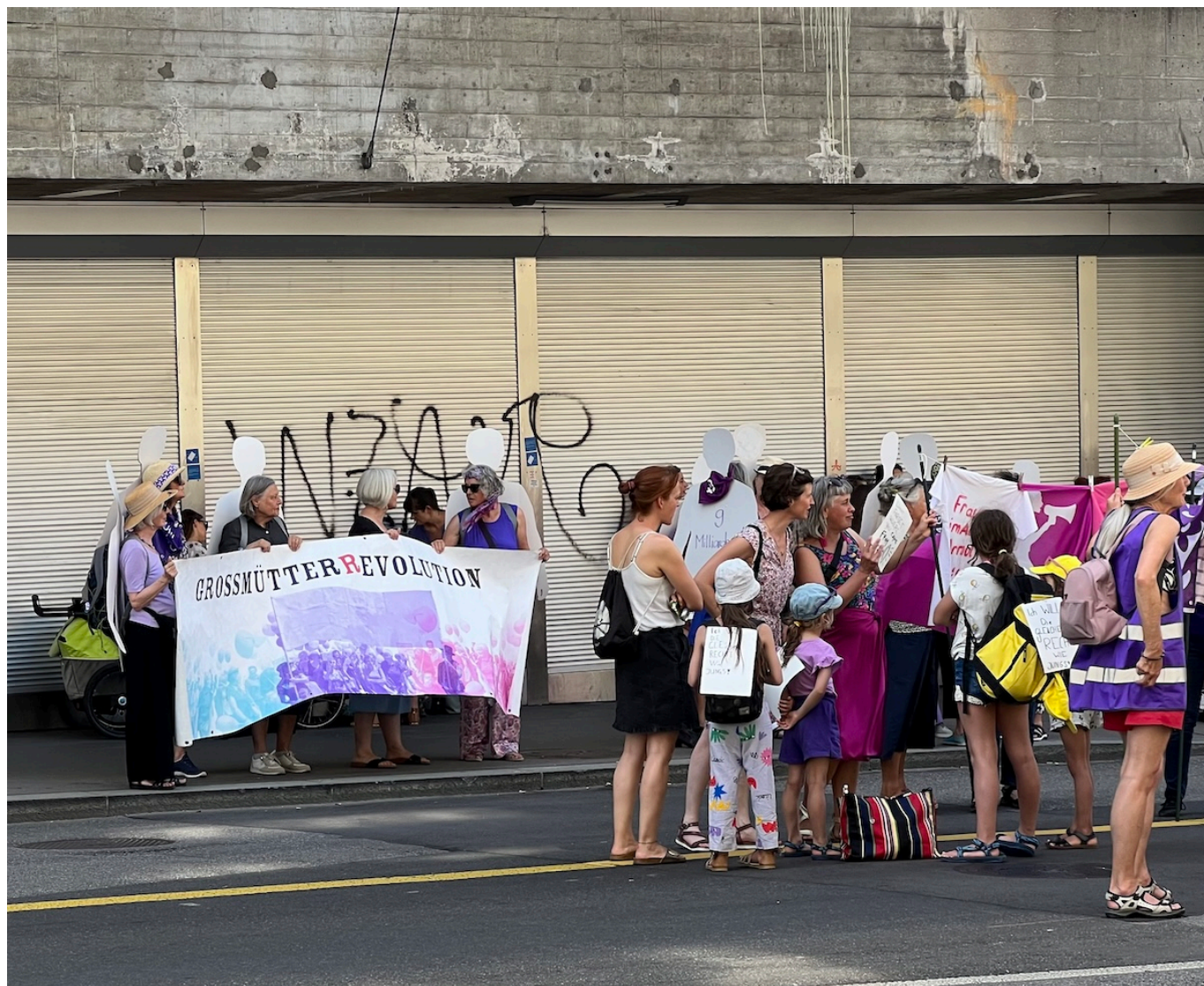
«Революция бабушек» на забастовке в Берне.

Еще одно важное направление работы – борьба с домашним насилием и сексуальными домогательствами на рабочем месте. По данным опросов, половина всех работающих женщин сталкивалась с сексуальными домогательствами или сексистскими комментариями на работе. Что касается насилия, то цифры говорят сами за себя. В прошлом году центры поддержки жертв в Швейцарии зарегистрировали рекордное количество консультаций – 51 547 обращений, что на 5% больше, чем годом ранее. Почти три четверти консультаций были запрошены женщинами-жертвами или их родственниками жертв. Почти 18% жертв на момент консультации были несовершеннолетними. В 71% случаев жертва знала обидчика, а в 78% случаев им был мужчина (причем в четырех из десяти случаях это был партнер или бывший партнер жертвы). 46% консультаций касаются телесных повреждений или нападения, треть – вымогательства или шантажа, а также угроз или принуждения. Преступление против сексуальной неприкосновенности упоминается в 30% случаев. Специализированные учреждения с трудом справляются с запросами и требуют больше ресурсов, чтобы реагировать на ситуации, которые часто носят экстренный характер.