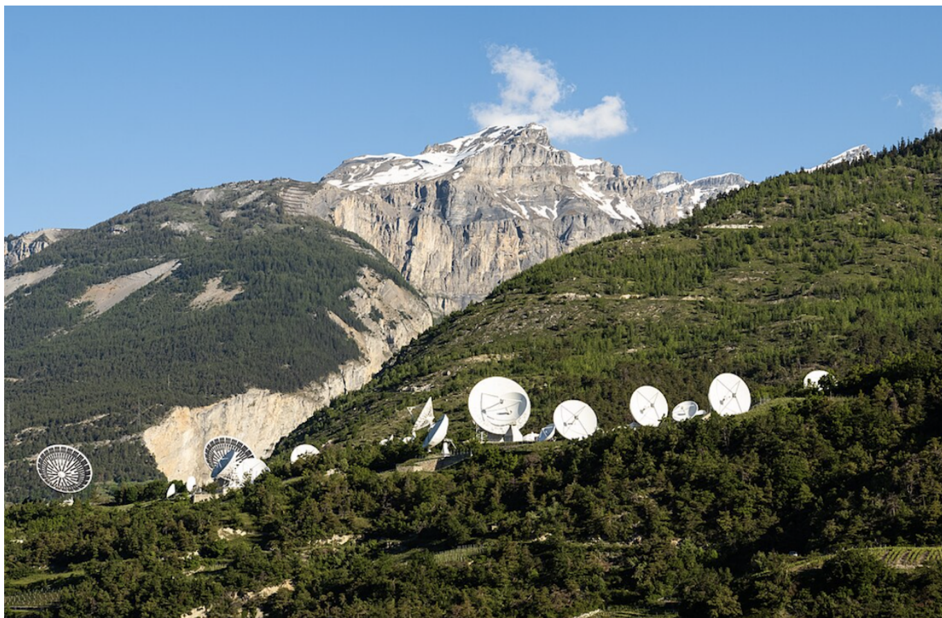
Антенны в Лойке.

Автор: Заррина Салимова, Лойк-Берн , 12.06.2025.