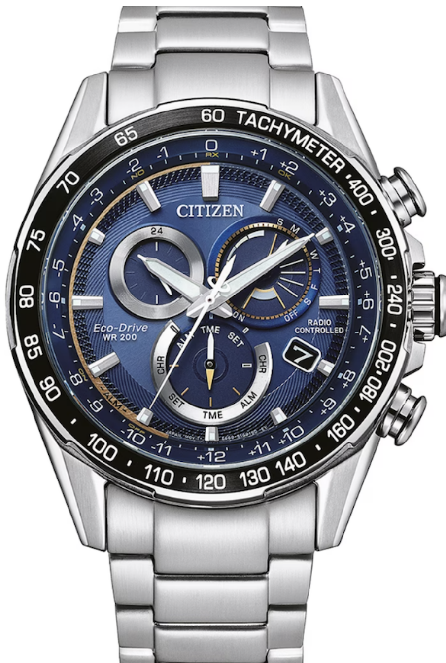
Citizen Chrono PCAT Eco-Drive Radio Controlled

Единственным федеральным советником, носящим смартвотч, оказался Иньяцио Кассис, на запястье которого журналисты разглядели модель французской марки Withings. У него также есть механические швейцарские часы Oris Artelier Date.