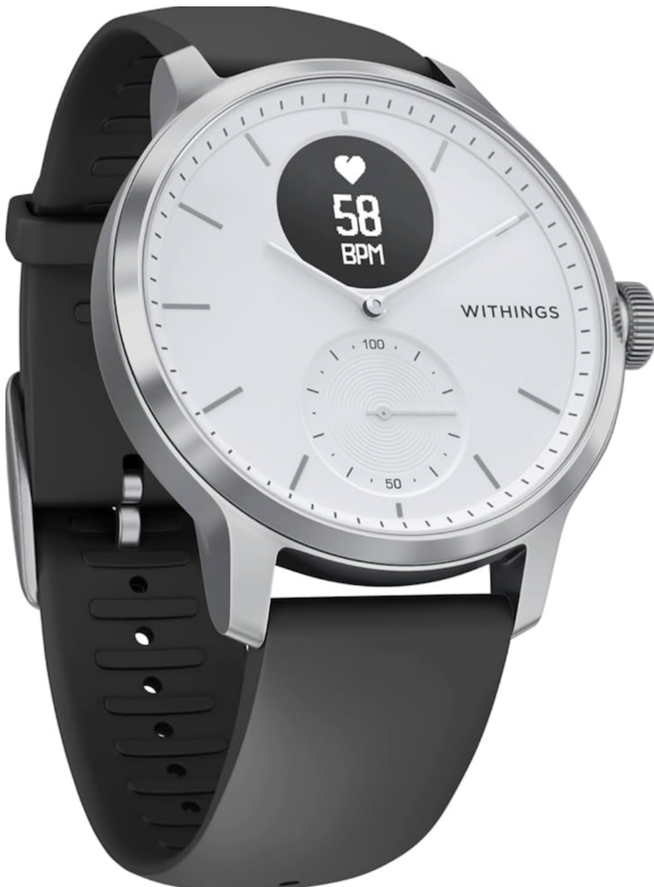
Одна из моделей смартвотчей марки Withings

А вот министра транспорта и энергетики Альберта Решти чаще всего можно увидеть без часов. На старых фотографиях, относящихся к тому периоду, когда политик был главой Народной партии Швейцарии, он носил демократичные, негламурные и