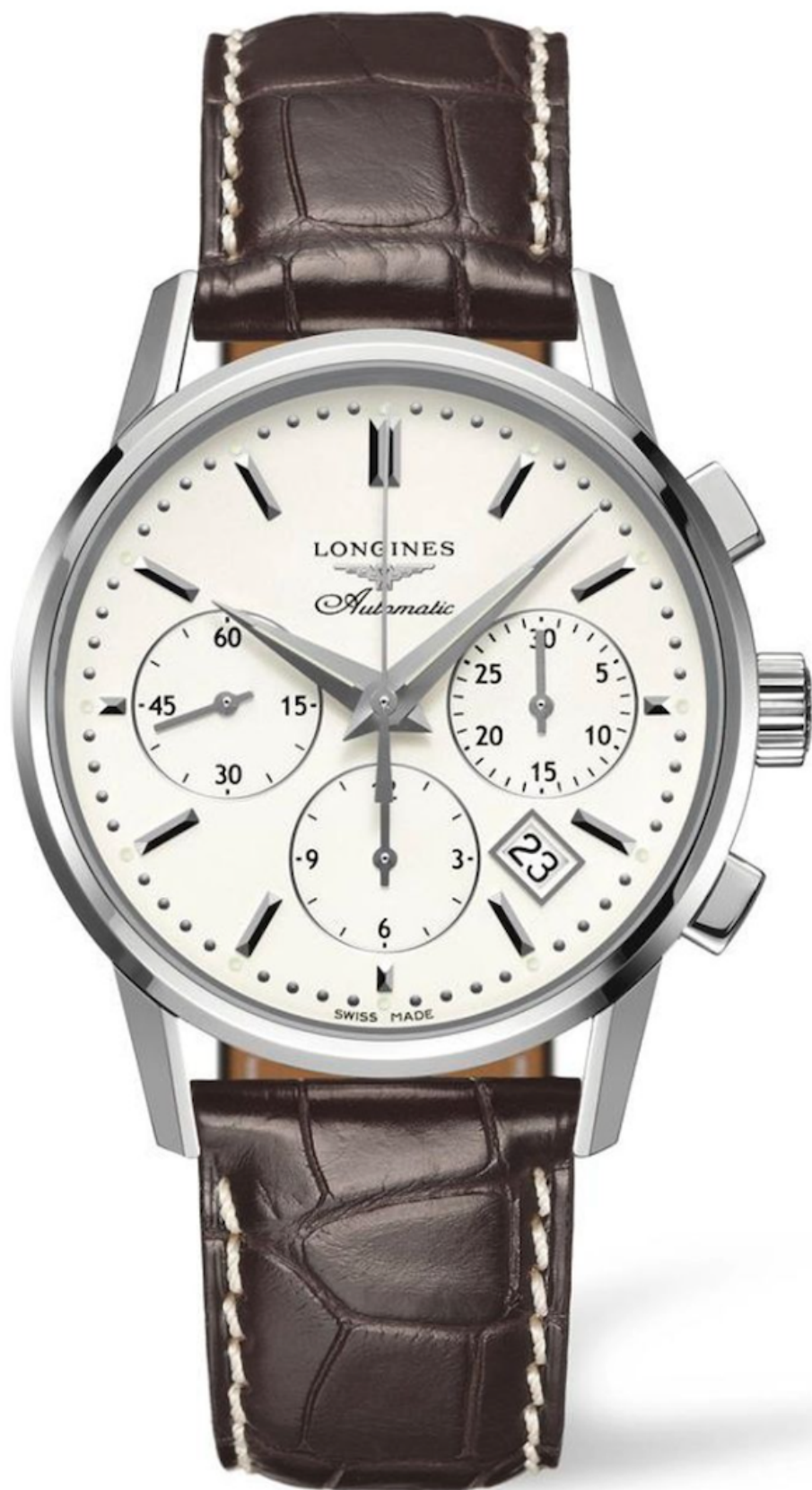
Longines Column Chronograph

Недавно избранный в федеральный совет министр обороны Мартин Пфистер родом