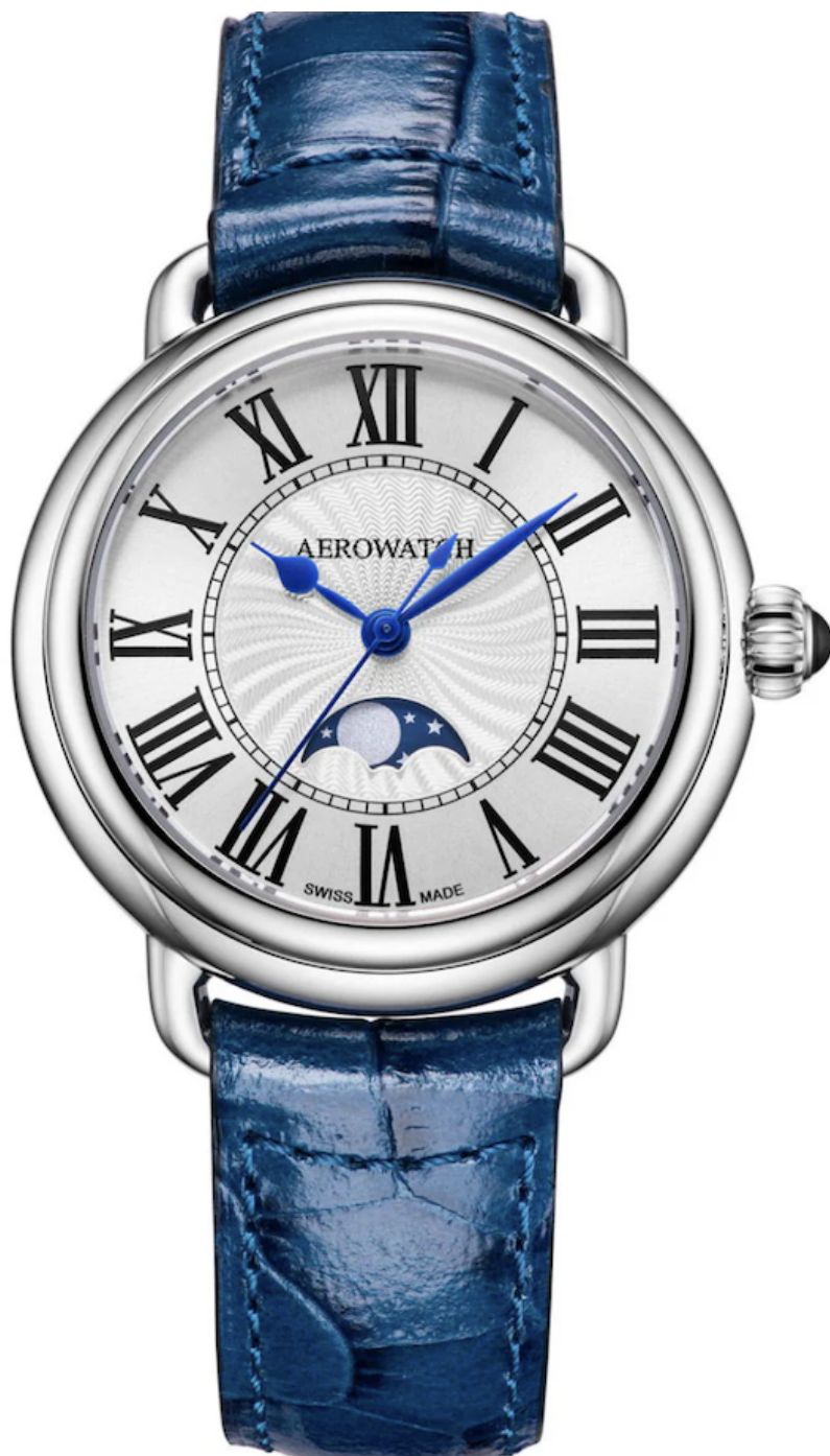
Aerowatch Lady Moon-Phase

Министр экономики Ги Пармелен предпочитает элегантную классику и уже много лет носит Longines Column Chronograph. Марка из Сент-Имье входит в группу Swatch и производит механические и кварцевые часы в среднем и высшем ценовом сегменте.