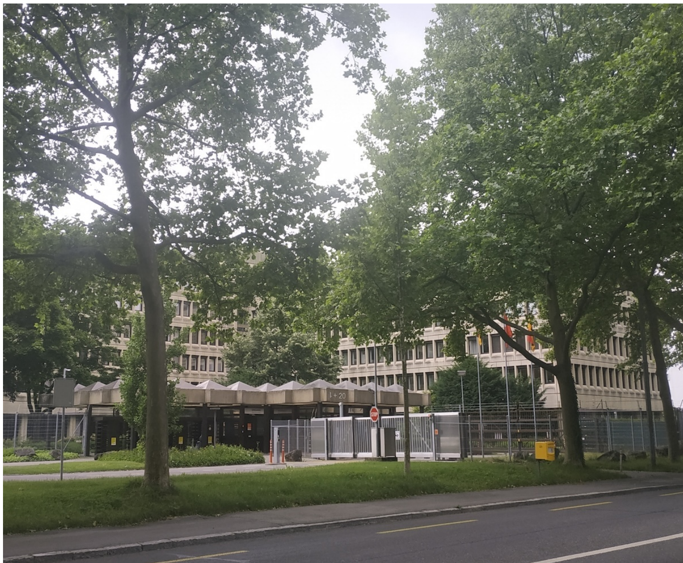
Здание SRC/NDB в Берне.

Автор: Заррина Салимова, Берн , 05.06.2025.